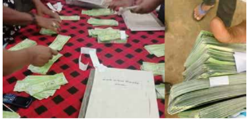
கிளிநொச்சி, மே 04

போலி நாணயத்தாள்களுடன் கிளிநொச்சியில் ஒருவர் கைது செய்யப்பட்டுள்ளார். அவரிடம் இருந்து 8 இலட்சத்து 10 ஆயிரம் ரூபாய் பெறுமதியான ஆயிரம் ரூபாய் போலி நாணயத்தாள்கள் கைப்பற்றப்பட்டுள்ளன என்று பொலிஸார் தெரிவித்தனர்.