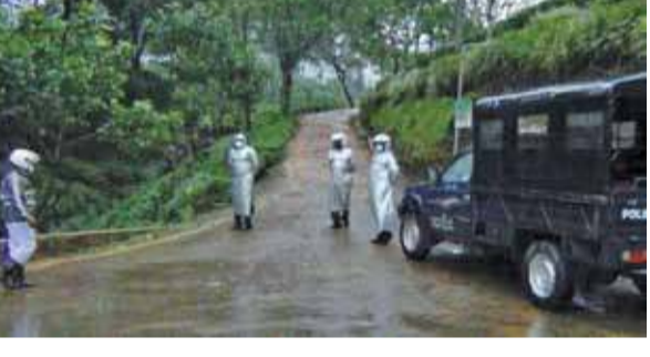
ஜெஸ்ட்ரி, பாத்தோட் பிரிவு, பிரட், பிலின்கிபோனி மற்றும் அபகனி, ஆகிய பகுதிகளே இவ்வாறு தனிமைப்படுத்தப்பட்டுள்ளன.

(க.கிஷாந்தன்) நோர்வூட் இன்ஜெஸ்ட்ரி கிராம அலுவலகர் காரியாலயத்திற்கு உட்பட்ட தோட்ட பகுதிகள் நேற்று திங்கட்கிழமை பிற்பகல் முதல் தனிமைப்படுத்தப்பட்டுள்ளதாக பொகவந்தலாவ சுகாதார வைத்திய அதிகாரி காரியாலயம் தெரிவித்துள்ளது. நோர்வூட் ஹொன்சி பகுதி, இன்