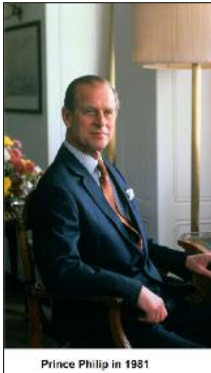
Prince Philip in 1981

அரசு குடும்பத்திற்குரிய இணையதளத்தில் பொதுமக்கள் தமது அஞ்சலிகளைப் பதிவிட வசதிகள் செய்யப்பட்டுள்ளன. ஆனாலும் பொதுமக்கள் வின்ஸர் அரண்மனைக்கு வெளியில் பூக்கொத்துக்களை தொடர்ந்து வைத்துக் கொண்டிருக்கின்றனர். St.George's Chapelஇல் ஏப்பிரல்