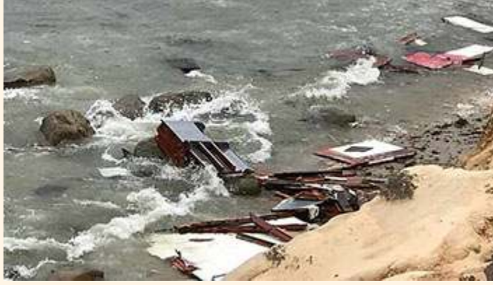
அங்கிருந்த ஒரு பாறையின் மீது மோதியது. இதில் படகு உடைந்து சுக்கு நூறாக நொறுங்கியது.

நேற்று முன்தினம் இந்த படகு சாண்டியாகோ நகருக்கு அருகே கடலில் சென்று கொண்டிருந்தபோது, எதிர்பாராத விதமாக