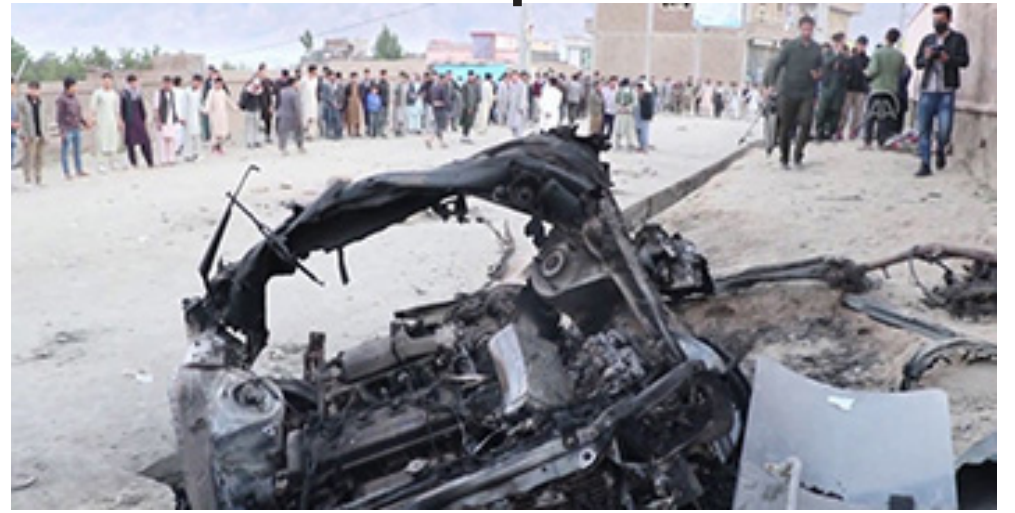
ஆப்கானிஸ்தானில் நடத்தப்பட்ட குண்டு வெடிப்பில் 55 மாணவிகள் கொல்

லப்பட்டனர். தலைநகர் காபூலின் மேற்குப் பகுதியில் உள்ள ஷியா இனத்தவர் அதிகம் உள்ள தஷத் இ பார்ஷி என்ற இடத்தில் மேல்நிலைப் பள்ளி ஒன்றின் அருகில் இந்தக் குண்டு வெடிப்பு நடத்தப்பட்டுள்ளது.