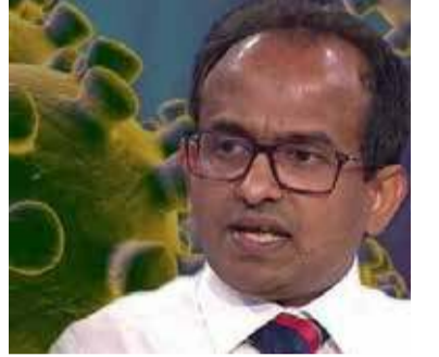
காணப்பட்டுள்ளது. பி.1.617 என்ற வைரஸே இவ்வாறு அடையாளம் காணப்பட்டுள்ளது என்றும் அவர் மேலும் தெரிவித்தார். (இ)