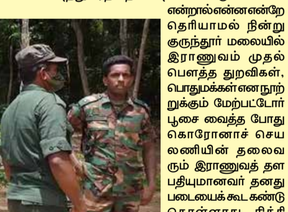
குருந்தூர் மலையில் பணியிலுள்ள இராணுவம்

ஒரு பக்கம் பொரோனா உச்சம்பெற மறுபுறம் 20 பேர் நின்று துடுப்பாட்டம் ஆடியவர்கள், 50 பேர் நின்று சைவ ஆலயங்களில் பூசை வைந்தவர்கள், முக்கவசம் அணியாது சென்ற முதியவர்களையெல்லாம் மடக்கிப் பிடித்து வீரத்தை காட்டினார்கள். முக்கவசம்