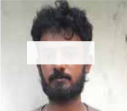
மன்னார் ஊடாக யாழ் வந்தவர்

நாட்டின் அத்தியாவசிய பணிகளை மேற்கொள்பவர்களிற்கு தடுப்பூசி ஏற்று வதற்கு விவரங்கள் தற்போதும் அரசினால் கோரப்பட்டுள்ளன. இருப்பினும் இந்தத் தடுப்பூசியைப் பெறவும் கொழும்பிற்கே பயணிக்க வேண்டும் எனவும் கோரப்படுகின்றது. மாகாணத்திற்கு மாகாணம் பயணத் தடைகாலத்தில் உண்மையில் அந்தத் தடுப்பூசி மாகாணங்களில் ஏற்றுப்பட்டு வேண்டும் எனக் கோரிக்கை முன் வைக்கப்படுகின்றது. ஏனெனில் கொழும்பு சென்று தங்கி ஊசியை பெற்று வரும் சமயம் கொரோனாவையும் பெற்று வரவேண்டிய சூழல் ஏற்படுமோ என்ற நியாயமான சந்தேகம் எழுகின்றது.