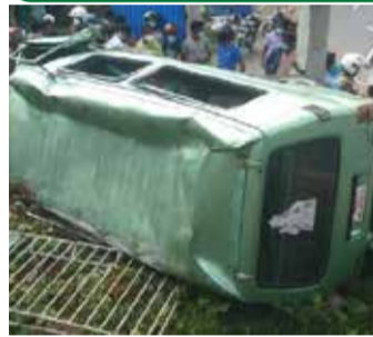
பதுளையிலிருந்து தியனகல தோட்டத்துக்கு ஆள்களை ஏற்றிச் சென்ற வான் ஒன்று பதுளை

- பசறை மூன்றாம் கட்டை பகுதியில் வைத்து தடம்புரண்டு விபத்துக்குள்ளாகியதில் ஒருவர் பலியாகியுள்ளார். மேலும் 10 பேர் படுகாயமடைந்துள்ளனர்.