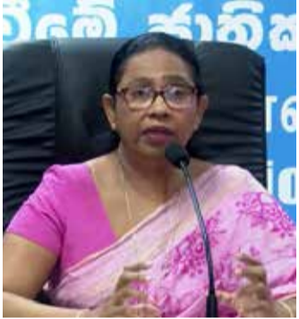
இலங்கையில் பரவி வரும் கொரோனா வைரஸ் பரவலைக் கட்டுப்படுத்தும் விதமாக சீன, ரஷ்ய, அமெரிக்க தடுப்பூசிகளைப் கொள்வனவு செய்வதற்காக 136

கோடி ரூபா நிதி ஒதுக்கப்பட்டுள்ளது எனவும், தேவைப்படும் பட்சத்தில் மேலதிகமாக நிதி ஒதுக்க முடியும் எனவும் சுகாதார அமைச்சர் பவித்ரா வன்னியாராச்சி தெரிவித்தார்.