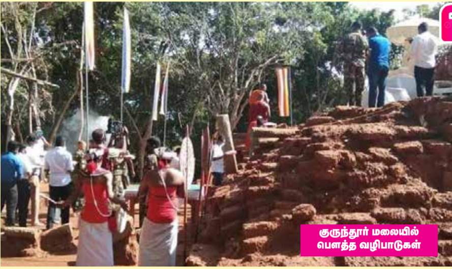
குருந்தூர் மலையில் பளத்த வழிபாடுகள்

புதுக்குடியிருப்பு ஆடைத் தொழிற்சாலையில் பெறப்பட்ட மாதிரிகளுக்கு 7 தினங்களின் பின்பு பெறுபேறு வழங்கப்பட்டது. அதில் 7 பேருக்கு கொரோனா உறுதி செய்யப்பட்டுள்ளது. இதில் எவரைத்தவறு சொல்வது? 5ஆம் திகதி பி.சி.ஆர். மாதிரிகளை வழங்கியவர்கள் 11 ஆம் திகதி வரையில் பணியிலும் ஈடுபட்டுள்ளனர். இதேபோன்று பெறுபேறு 11ஆம் திகதி இரவு வரும் வரையில் வெளியே நடமாடினர் அதனால் பாரிய சுகாதார நெருக்கடி எதிர்நோக்கப்படுகின்றது. அதாவது 7 பேர் கொரோனாவோடு 7 நாள்நடமாடியுள்ளனர். இதன் காரணத்தினால் - ஆடைத் தொழிற்சாலையினருக்கு வழங்கிய அறிவுரையை ஏற்காத காரணத்தினால் - தற்போது புதுக்குடியிருப்பு பிரதேசமே முழுமையாக முடங்கும் ஆபத்திற்கு செல்வதாக ஒருதரப்பு அச்சம் தெரிவிக்கின்றது.