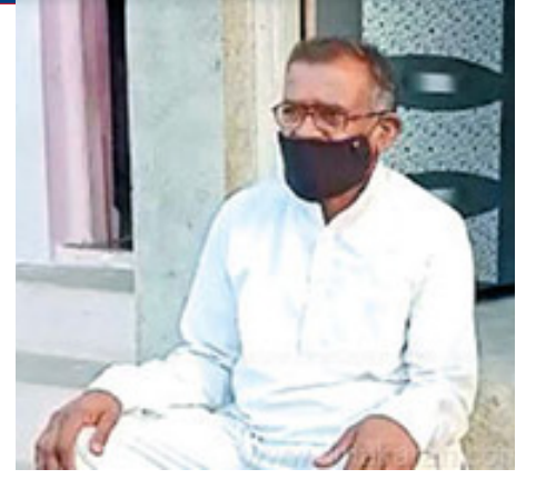
செய்துள்ளோம்' என்று அவர் தெரிவித்துள்ளார்.

எனது தந்தை படிப்பறிவற்றவர். எனக்குக்கூட ஓரளவுதான் வாசிக்கத் தெரியும். சுகாதாரப் பணியில் ஈடுபட்டுள்ளவர்கள் சரியான தடுப்பூசிதான் அளிக்கப்படுகிறதா என கவனிக்க வேண்டுமில்லையா? அவர்களது கடமை அது. இதுகுறித்து உள்ளூர் சுகாதார அதிகாரிகளிடம் புகார்