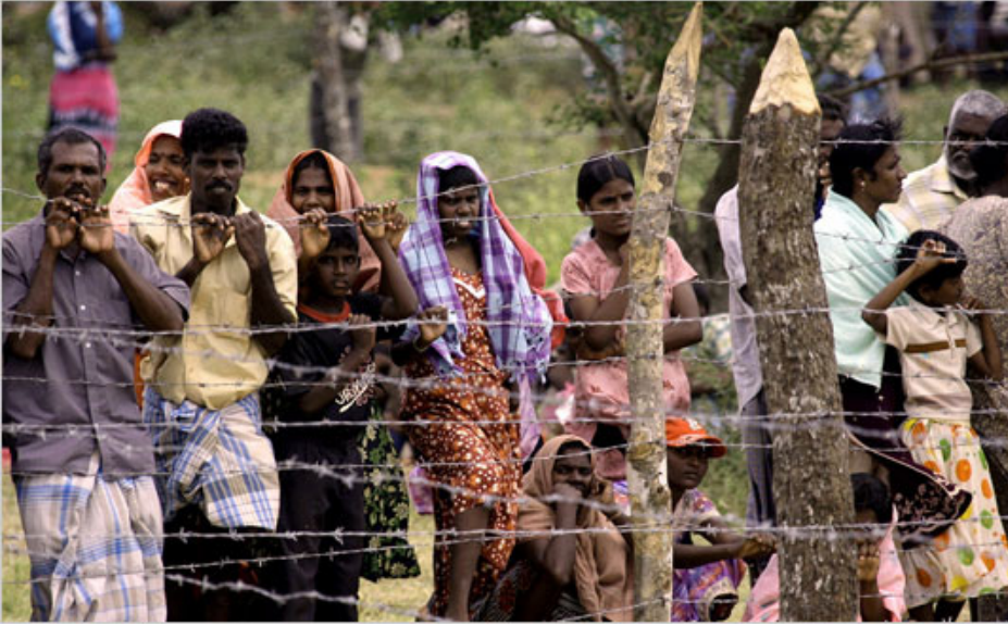
பற்றி இப்பொழுது தன்னால் கவலைப்பட முடியாது என்றும் இறுமாப்புடன் கொக்க ரித்தார்.