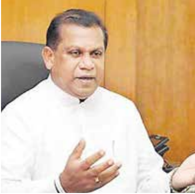
கொழும்பு, மே 16 கொவிட் தொற்றுநோயைக் கட டுப்படுத்த அரசாங்கத்தின் திட்டமிடல்

படாத செயற்பாட்டால் நாட்டு மக்கள் கடுமையான சவால்களை எதிர்கொள் கின்றனர் என ஐக்கிய மக்கள் சக்தி தெரிவித்துள்ளது.