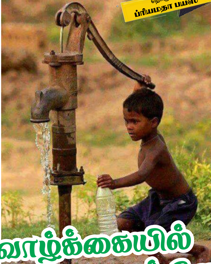
தொகுப்பு - ப்ரியமதா பயஸ் -