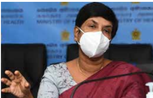
பி.சி.ஆர். பரிசோதனைகளில் கொரோனா வைரஸ் தொற்று உறுதி செய்யப்பட்ட போதிலும்