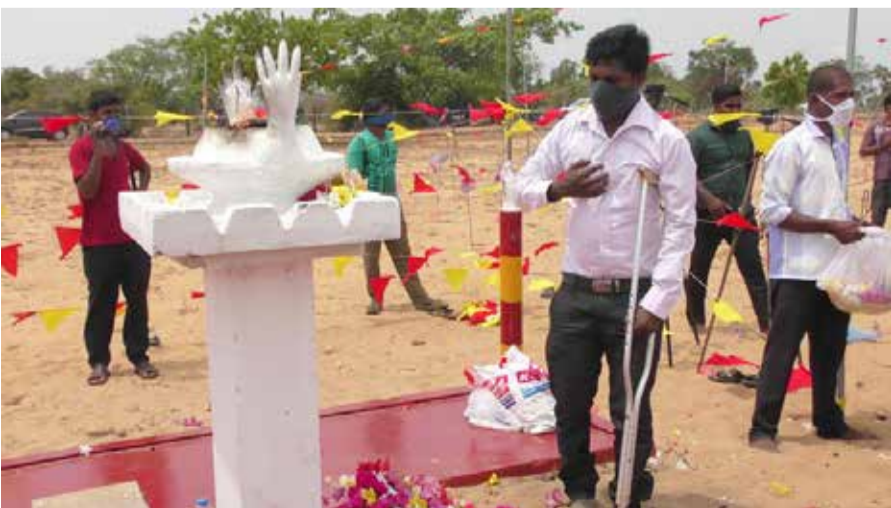
மக்களின் இருப்புக்கு பெரும் சவாலாக கொவிட் - 19 அலை உருவெடுத்துள்ள நிலையில் சிறிலங்கா

மேலும் வடக்கு கிழக்கு தமிழர் தாயகத்தில் தமிழ்