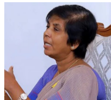
டம் அமைச்சர் கோரியுள்ளார்.

தங்களது பிரதேசங்களில் காணப்படும் வைத்தியசாலைகளுடன் இணைந்து தேவையான உதவிகளை வழங்குமாறு செல்வந்தர்களிடம் அமைச்சர் கோரியுள்ளார்.