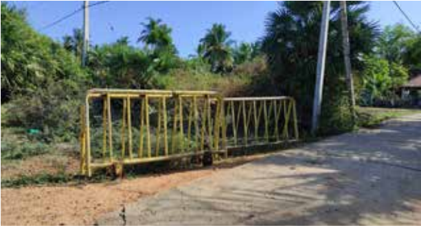
இறுதி யுத்தத்தில் பல்லாயிரக்கணக்கான மக்கள் கொல்லப்பட்ட முள்ளிவாய்க்கால் மண்ணில் வருடம்

தோறும் மே 18 தமிழ் மக்கள் நினைவேந்தல் நிகழ்வுகளை மேற்கொண்டு வருகின்றனர்.