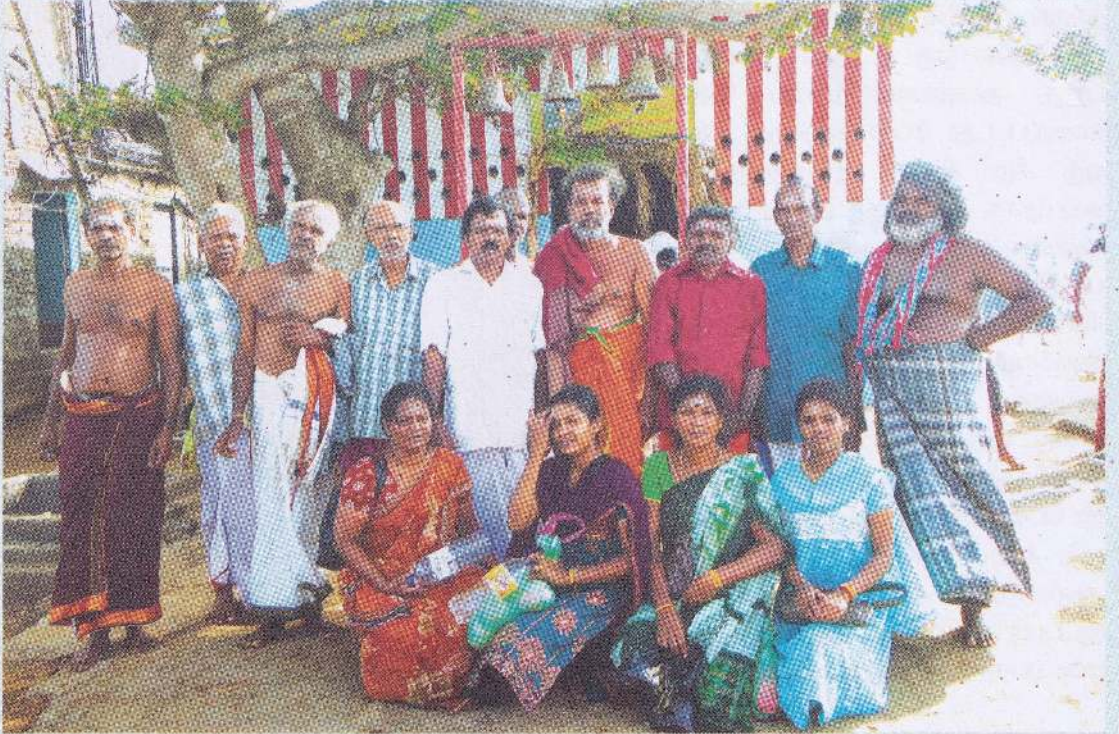
வாழ்க்கைக்கு முச்சு எவ்வளவு அவசியமோ அப்படியேதான் உழைப்பும்.

உச்சிமலையை அண்டியதும் குளிர்ந்த காற்று, பனிமுகில் கூட்டம், அரோகரா எனும் அடியார்களின் சத்தம் மேலே ஏறிவிட்டோம் என்ற ஆனந்தக் களிப்பு எல்லாமாகச் சேர்ந்து நாம் மலையேறிய களைப்பைப் போக்கிவிட்டது. மலை உச்சியிலிருந்து பார்க்கும்போது கதிரகாமச் சூழல் மிகவும் அழகாகக் காட்சியளித்தது.