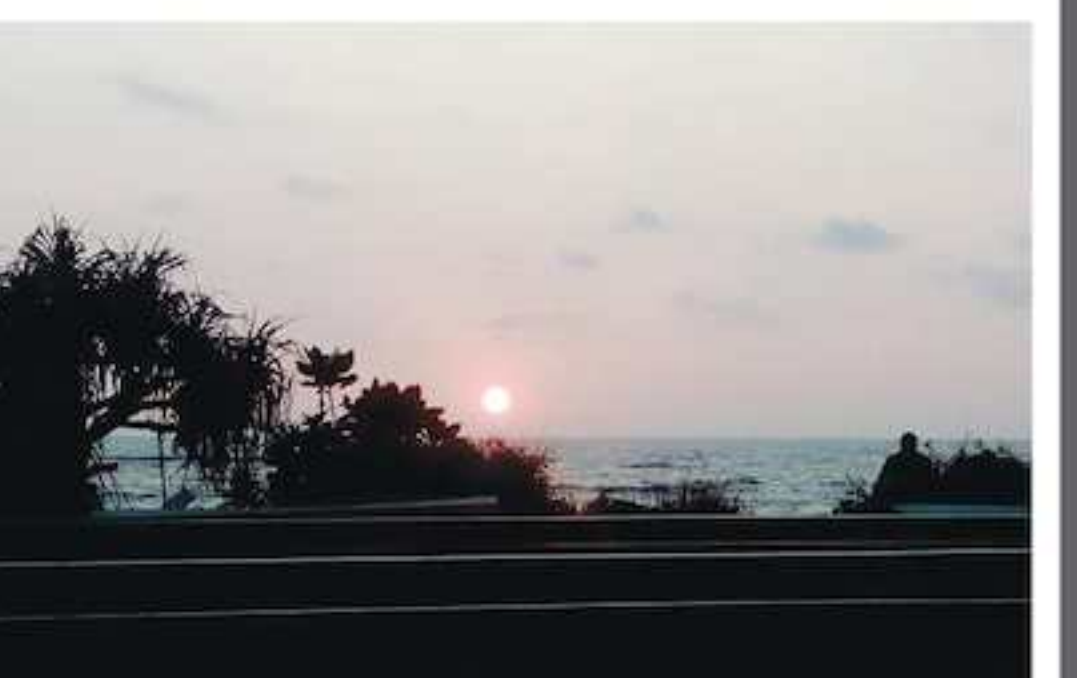
மாலைநேரம் (கொழும்பு) விதுஷியா