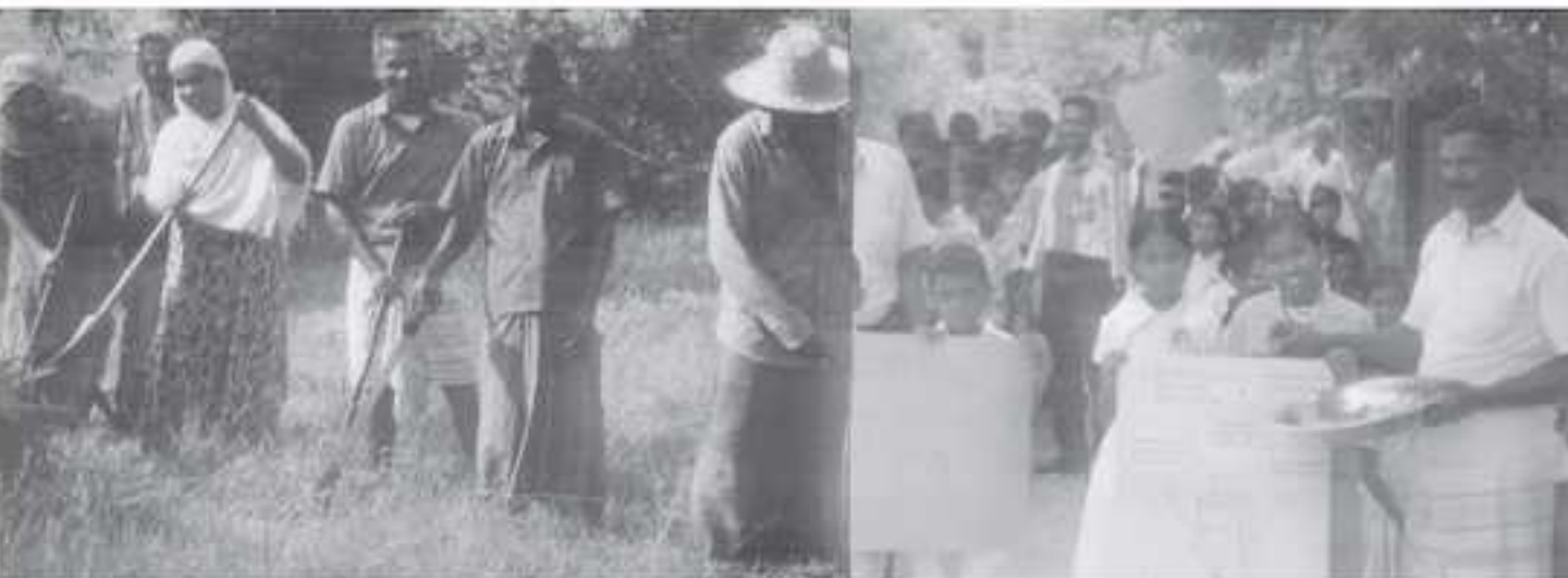
பொலன்னேறுவை மாவட்டத்தில் பின்தங்கிய பிரதேசங்களில் உள்ள பாடசாலைகளில் மழைகாலங்களில் டெங்கு பரவாமல் இருக்க நடவடிக்கை எடுக்கப்பட்டுள்ளது. கல்வி வலய மட்டத்தில் சிங்கள மற்றும் தமிழ்மொழி மூல பாடசாலைகளில் மாணவர்கள், ஆசிரியர்கள், பெற்றோர்களுடன் இணைந்து டெங்கு ஒழிப்பு சிறமான திட்டங்கள் விடுமுறை நாட்களில் அறிப்புகளின் தலைமையில் இடம்பெற்றுவருகின்றது. மாணவர்கள் கிராமங்கள் ஊர்வலமாக சென்று டெங்கு ஒழிப்பு தெளிவுட்டும் நிகழ்வுகளும் இடம்பெற்றுகிறது. பொ/ நுகசுலாபதெமென முஸ்லிம் வித்தியால மாணவர்கள் ஊர்வலமாக சென்று மக்களுக்கு தெளிவுட்டுவதையும் பெற்றோர்கள் மகளிர் அமைப்புக்கள் இணைந்து பாடசாலை தோட்டத்தில் சிறந்தான பணியில் ஈடுபட்டுள்ளதைப் படத்தில் காணலாம்.