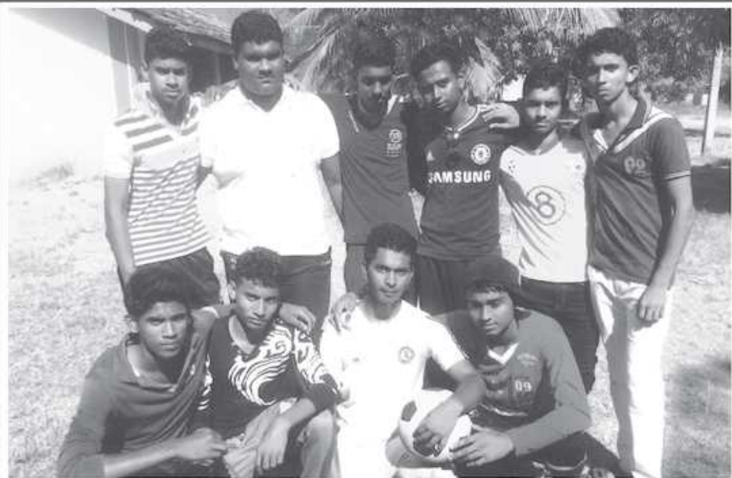
பலாகல் கோட்ட மட்ட பாடசாலைகளுக்கிடையிலான உதைபந்தாட்டப்போட்டியில் 19 வயதின் கீழ் ஆண்களுக்கான போட்டியில் வெற்றி பெற்ற நெல்லியகம் முஸ்லிம் மகா வித்தியால அணியினரை படத்தில் காணலாம்.