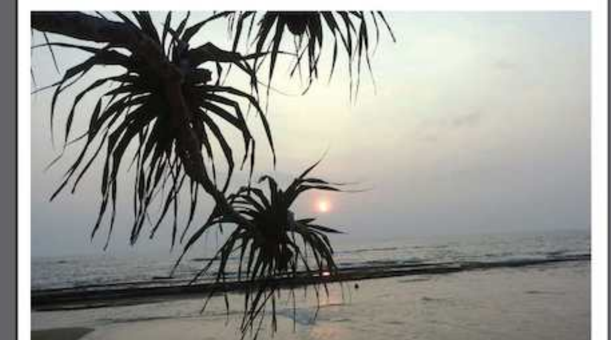
கடற்கரை (பேருவளை) சப்ராள் பாளஞ்சு