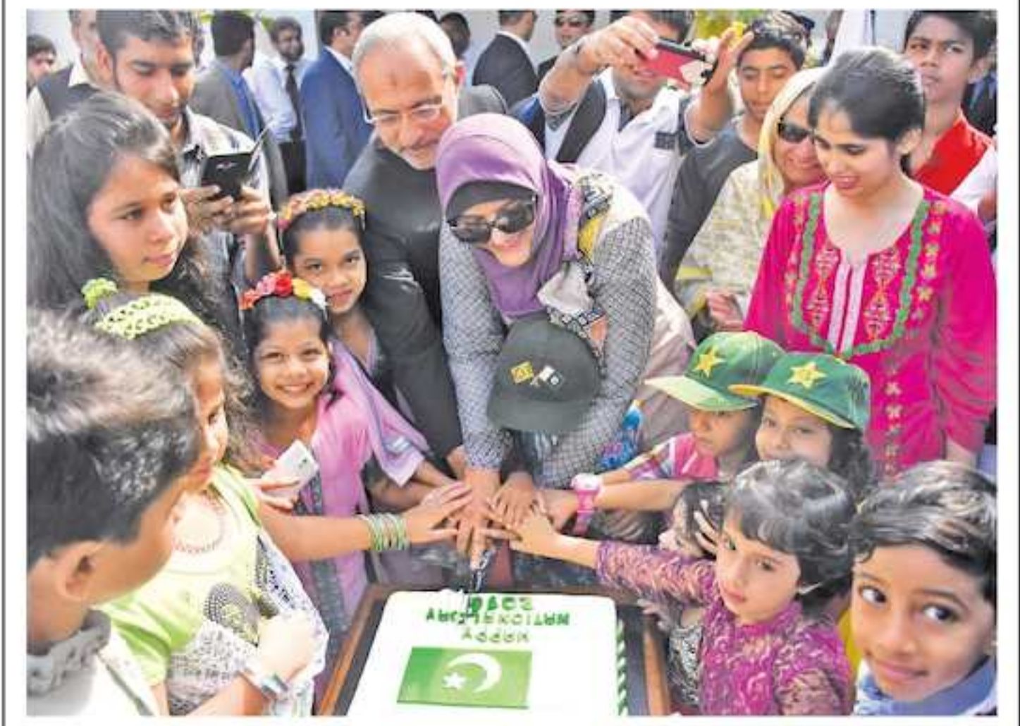
பாசில்தான் இஸ்லாமிய குடியரசின் 76ஆவது தேசியநினைவை முன்னிட்டு நேற்று கொழும்பிலுள்ள பாசில்தான் துறாவரலயத்தில் இடம்பெற்ற நிகழ்வில் இலங்கைக் கான பாசில்தான் உயர் ஸ்தானிகர் மேஜர் ஜெனரல் சகீல் ஹாசைன் தம்பதிகள் சிறுவர்களுடன் இணைந்து கேக் வெட்டி கொண்டாடுவதை படத்தில் காணலாம்.