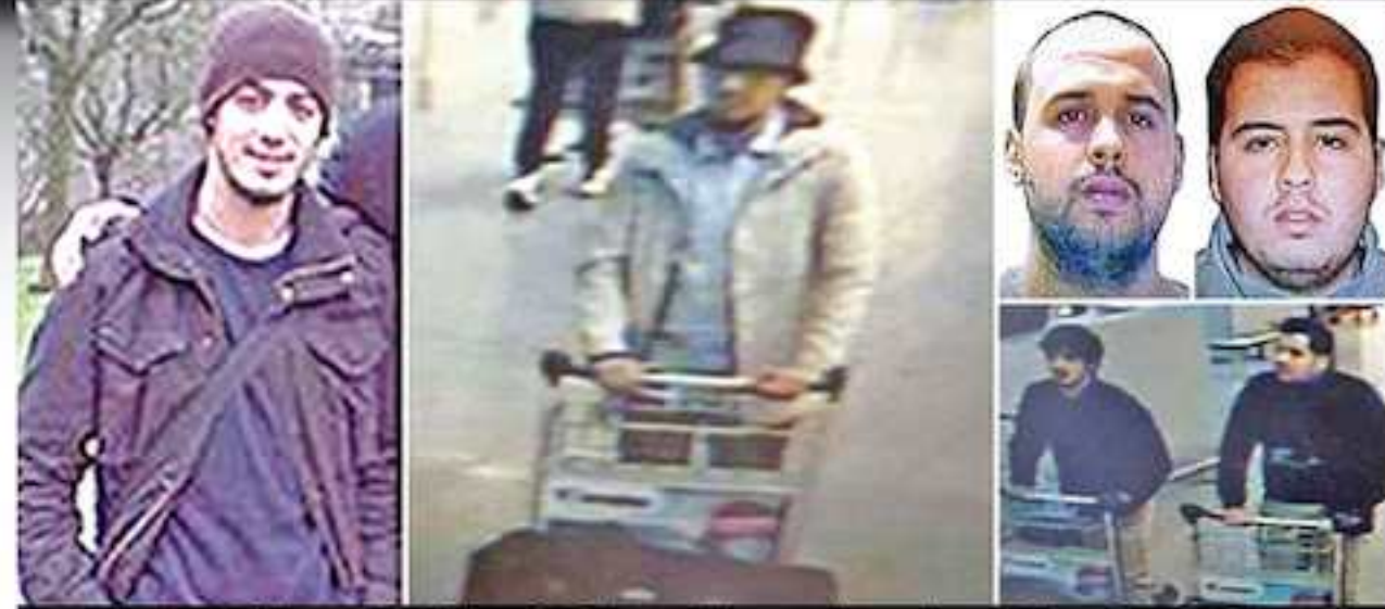
FACES OF TERROR

பிரசல்ஸில் நகரில் தற்கொலைப்படை தீவிரவாதிகள் தாக்குதல் நடத்தியுள்ளது பாதுகாப்பு படையினர் மேற்கொண்ட ஆய்வில் உறுதி செய்யப்பட்டது. அதுமட்டுமல்லாது அவர்கள் மூவரும் அடையாளம் காணப்பட்டுள்ளனர். முதலில் கண்ணாடி அணிந்தபடி, வெள்ளைநிற மேல்கோட், கருப்பு தொப்பியுடன் காணப்பட்டும் குறுந்தாடி நாய், ஒரு டிரொலியில் தனது குட்கேசை வைத்து தள்ளிச்செல்லும் காட்சிகள் அந்த புகைப்படங்களில் இடம்பெற்றுள்ளமை குறிப்பிடத்தக்கது. மேலும் தாக்குதலின்போது இறந்த தீவிரவாதியின் உடல் அருகே, ஒரு துப்பாக்கியும், விமான நிலைய வளாகத்தில் கிடந்த பெல்ட்டில் குண்டொன்றும் வெடிக்காத நிலையில் இருந்ததையும் பொலிஸார் பாதுகாப்பாக மீட்டுள்ளனர்.