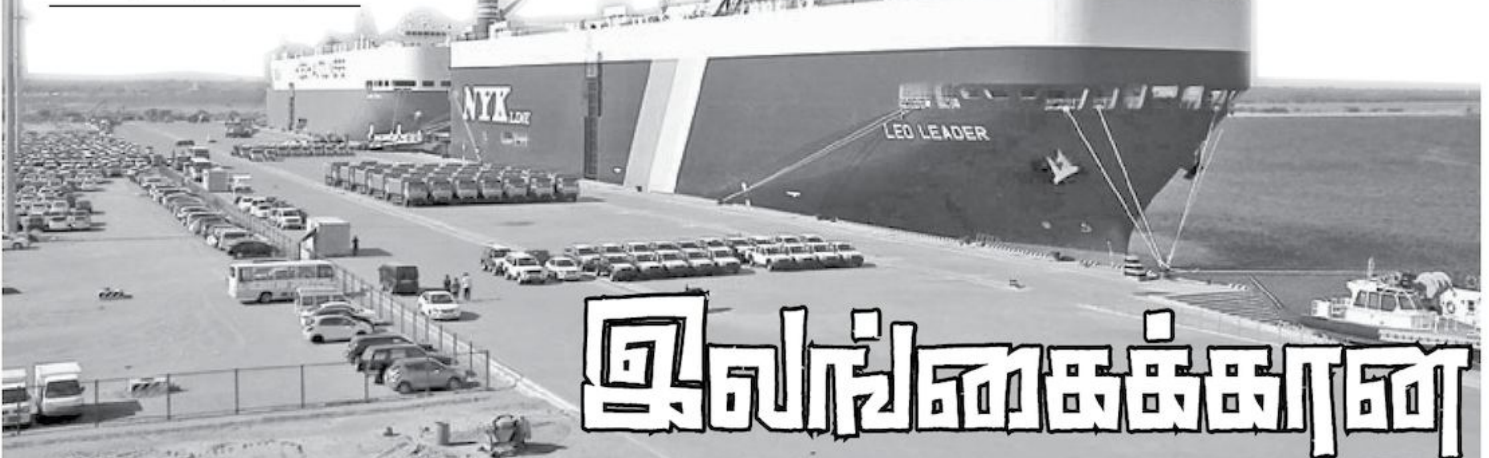
ஆங்கிலத்தில் - சம்ரால் ஐறா தமிழில் - நித்தியபாரதி

இலங்கை மீது செல்வாக்குச் செலுத்துவது தொடர்பில் சீனா, இந்தியா ஆகிய இரு நாடுகளுக்கு இடையில் மோதல் ஏற்பட்டுள்ளது. இலங்கை மீதான கடன் சுமை அதிகரித்த நிலையில் இவ்விரு நாடுகளுக்கும் இடையிலான மோதலை சமன்செய்து அதன்மூலம் தன் மீதான நிதி நெருக்கடியை குறைப்பதற்கு இலங்கை முயற்சிக்கிறது. இலங்கை மற்றும் இந்தியா ஆகிய இரு நாடுகளும் திருகோணமலை துறைமுகத்தை அபிவிருத்தி செய்வது தொடர்பான உடன்பாடு ஒன்றை எட்டியுள்ளதாக கடந்த ஜனவரியில், இலங்கையின் பிராந்திய அபிவிருத்தி அமைச்சர் சரத் பொன்சேகா தெரிவித்திருந்தார். இலங்கையின் பொருளாதாரத்தில் சீனாவின் தலையீடு அதிகரித்துவரும் நிலையில் இந்தியாவை அமைதிப்படுத்துவதற்காகவே திருகோணமலை துறைமுக உடன்பாடு எட்டப்பட்டதாக இலங்கையர்கள் கருதுகின்றனர்.