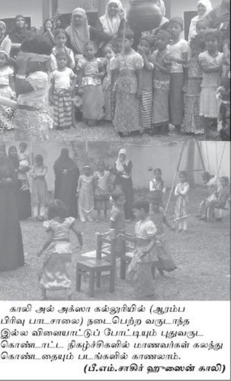
காலி அல் அக்லா கல்லூரியில் (ஆரம்ப பிரிவு பாடசாலை) நடைபெற்ற வருடாந்த இல்ல விளையாட்டுப் போட்டியில் புதுவருட கொண்டாட்ட நிகழ்ச்சிகளில் மாணவர்கள் கலந்து கொண்டதையும் படங்களில் காணலாம். (பி.எம்.சாகிர் ஹுஸைன் காலி)