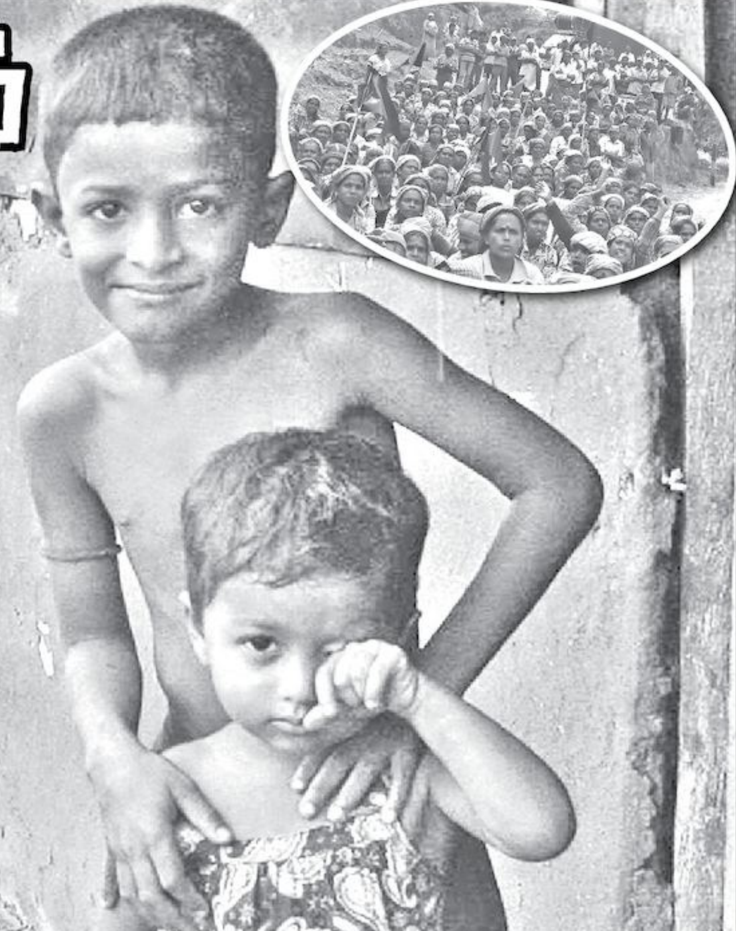
கள் என இருபிரிவுகளாக மேற்கொள்ளப்பட்டன. இந்த கூட்டு ஒப்பந்தம் கைச்சாத்திடப்பட்டபோது வெறும் 98 ரூபாவாகவே காணப்பட்ட ஒரு தோட்ட தொழிலாளியின் அடிப்படை சம்பளம் இன்று 450 ரூபாவாக காணப்படுகின்றது. ஆக, இந்த 17 வருட முடிவில் ஒரு தோட்ட தொழிலாளி ஒருவரின் சம்பளம் 352 ரூபாவே அதிகரிக்கப்பட்டுள்ளது. அதிலும் வருடமொன்று 22 ரூபாவே அதிகரிக்கப்பட்டுள்ளது.