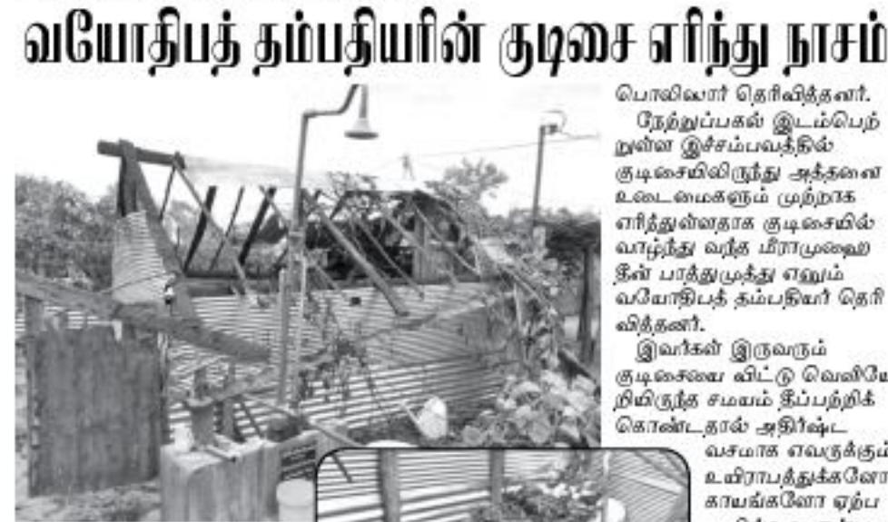
ஏறாஜார் ஏ.எச்.ஏ. ஹுஸைன்) ஏறாஜார், தாமரைக்கேணி கிராமத்தில் வர்போதிப்பட்ட தம்பதியினர் வசித்து வந்த குடிசையில் வெள்ளத்தினால் எரிந்து சாம்பலாகியுள்ளதாக ஏறாஜார்

(கோடுவணை பீ.எம்.முத்தார்) ஒரு பாடசாலையின் முன்னேற்றத்தில் பழைய மாணவர்களின் பங்கு மிக முக்கியமானதாகும். பாடசாலைகளில் நிலவும் முக்கிய குறைபாடுகளை நிவார்த்தி செய்தல், பாடசாலை அபிவிருத்திச்சங்கம் மற்றும் பழைய மாணவர் சங்கத்தில் அங்கம் வகிப்பதன் மூலம் பாடசாலையின் வளர்ச்சிக்கு பங்களிப்பு செய்வனாம். அந் தவணையில் பேருவணை சனை கோட்டை அல் ஹுமைஸரா தேசிய பாடசாலை 1990 ஆண்டு க.பொ.த சாதாரண தரத்தில் கல்வி கற்ற பழைய மாணவர்கள் ஒரு முன் மாற்றியான பணியை தாம் கற்ற பாடசாலைக்குச் செய்துள்ளமை பாராட்டப்பட வேண்டியதாகும் என அதிபர் எம். ஆர். எம். நிஷ்கி கூறினார். 1990 இல் க.பொ.த. சாதாரணத்தில்கல்வி கற்று பழைய மாணவர்கள் மேற்படி பாடசாலைக்கு மூன்று இவட்டம் குபா பெறுமதியான சி.சி.ரீவி கமரா உபகரண தொகுதியை கையளிக்கவும் வைப்பதில் பேசும் போது இவ்வாறு கூறினார். சனங்கோட்டை அல் ஹுமைஸரா தேசிய பாடசாலை அடுத்த வருடம் 2018 இல் நூற்றாண்டு விழாவை கோலாகலமாக கொண்டாடவுள்ளது. இதன் ஓர் அங்கமாகவே மேற்படி பழைய மாணவர்கள் இதனை அன்பளிப்புச் செய்துள்ளனர். அதிபர் மேலும் கூறுவதாவது, நாட்டுக்கும் சமூகத்துக்கும் பெருமளவிலான புகழினை உருவாக்கிய ஒரு பாடசாலையாக எழுது பாடசாலை திகழ்கிறது. பாடசாலை அபிவிருத்திச்சங்கம் பல்விச்சங்கம் உட்பட சமூக நல அமைப்புகளின் விளையாட்டுக்கழகங்கள் பழைய மாணவர்கள், அரசியல்வாதிகள் மிகவும் ஒற்றுமையாக இப்பாடசாலையின் முன்னேற்றத்திற்கு பெரும் பங்களிப்புச் செய்துள்ளனர். 2018 இல் நூற்றாண்டு விழாவை கொண்டாடவுள்ள நிலையில் எழுது பாடசாலைகளில் பல்வேறு குறைபாடுகள் உடனான என்றார். அஷ்ஷெக்க மக்கி மக்தூர் ஆலிம் லாபிர் மதனி ஹாசிஸ், அஸ்வர் வயா பர்ஹான், மஸ்லூதீன், ஹிம்மி, காஸிம், மஸூத் லஹீம் ஆகியோர் உபகரண தொகுதியை அதிபரிடம் கையளித்தார்.