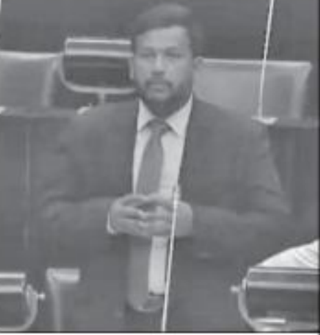
குலைப்பவர்களுக்கெதிராக ஹனாபிபதியும் பிரதமரும் நடவடிக்கை எடுக்க வேண்டும் என மீண்டும் இந்த உயர் சபையில் வலியுறுத்தி விரும்புகின்றேன். இந்த சம்பவங்களை உடன் தடுத்த நிறுத்த ஏற்ற நடவடிக்கை எடுக்காவிட்டால் விளைவுகள் விபரீதமாகும் என்பதையும் இந்த சபையில் கூறிக்கொள்ள விரும்புகின்றேன் என்று அமைச்சர் கூறினார்.

இல்லை. இத்தனை சி சி டி வி கமிராக்களை பொருத்தியும் என்ன பயன்? நாசகாரிகளை உட்களால் ஏன் இன்னும் கண்டுபிடிக்க முடியவில்லை. இது எங்களுக்கு வேதனையாக இருக்கின்றது. ஹுகேகோட விஜயராஜமயில் கடையொன்று எரித்தார்கள். அதே போல நடந்த சம்பவங்கள் அனைத்தையும் அடுக்கிக் கொண்டு போகலாம். முஸ்லிம்கள் சமூகம் ஆயுதம் தூக்கிய சமூகம் அல்ல. சிங்கள இளைஞர்களுடனோ, ஒரே மொழி பேசும் தமிழ் இளைஞர்களுடனோ இணைந்து ஆயுதம் தூக்கி போராடாத சமூகம். இருக்கின்ற நாட்டில் ஏனைய சமூகத்துடன் இணைந்து சமூகமாக வாழும் பழகிக் கொண்ட சமூகம். சூரி ஆணும் நயி பெருமானாகும் எங்களுக்கு அதனையே சொல்லித் தந்துள்ளனர். எனவே எங்களை நிம்மதியாக எடுப்பார்கள். எங்களுக்குக்கெதிராக செயற்பட்டு, எமது நிம்மதியை