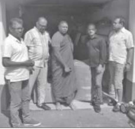
கடந்த சில நாட்களாக இலங்கையின் மலையகம், கருத்திஹை, இரத்தியபுரி, காவி, அம்பார்தோட்டை உட்பட தென்னிலங்கை எங்கும் ஏற்பட்ட மழை, வெள்ள அளர்த்தங்களினால், பாதிக்கப்பட்ட மக்களுக்கு, சில தமிழ் உறவுகள் தந்த பொருட்களை புங்குடுதீவு தாயகம் சமூக சேவை அகம் அமைப்பின் (கவில் பிரதிநிதிகள்) சார்பில் பொறுப்பேற்று, கவிரல் உள்ள பெளத்த விகாரை பீடாதிபதியின் உதவியுடன் இலங்கைக்கு அனுப்பி வைத்துள்ளது.