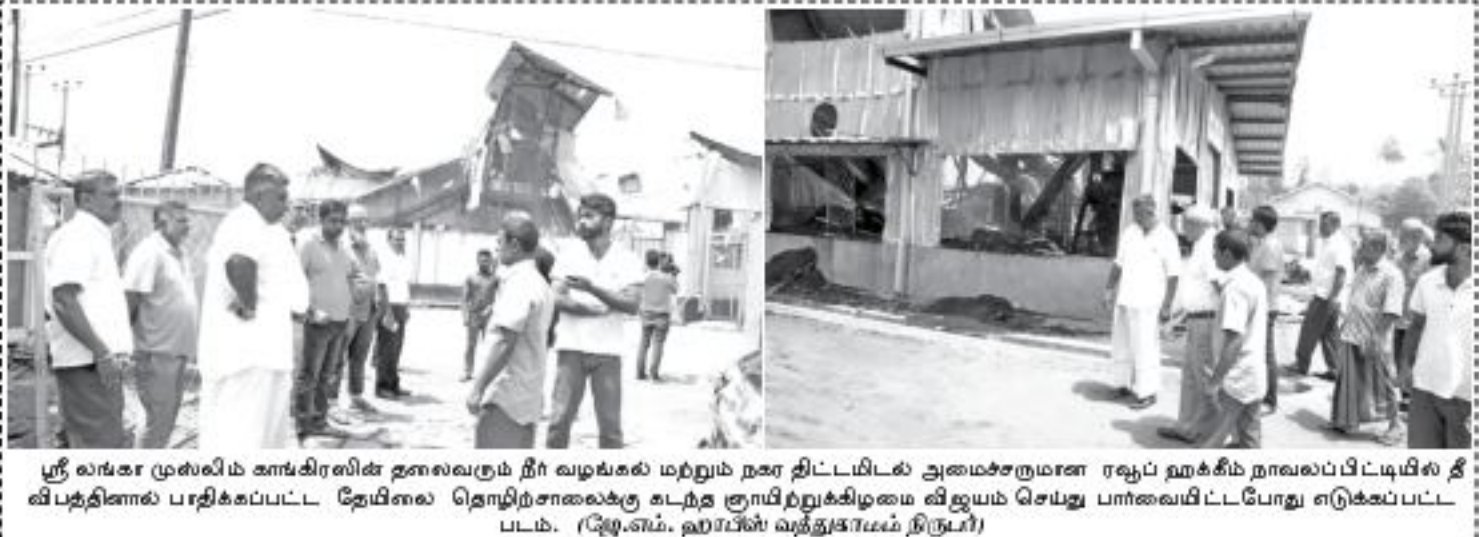
ஸ்ரீ லங்கா முஸ்லிம் காங்கிரஸின் தலைவரும் நிர்வாகரும் மற்றும் நகர திட்டமிடல் அமைச்சரான ரஷிப் ஹக்கீம் நாவலப்பிட்டியில் தீ விபத்தினால் பாதிக்கப்பட்ட தேயிலை தொழிற்சாலைக்கு கடந்த ஞாயிற்றுக்கிழமை விஜயம் செய்து பாளையிட்டிபோது எடுக்கப்பட்ட படம்.

பணமும் செலவு செய்தார்கள். எழுது முஸ்லிம்கள் மதிக்கும் பழக்கத்தை நாம் எம்மில் ஏற்படுத்திக் கொள்ள வேண்டும். இம்மியத்து உலமா இடில் ஒரு போதும் தவறுவது கிடையாது. முஸ்லிம்கள் செய்த ஆய்விக்கப் பணிகளை ஏற்பாடுகூட்டும் வலும் அவர்களது அந்தப் பணிக்காக துஆ செய்தும் அவர்களுடைய நலவுகளை, மனாபுகளை பேசி ஞாபகமூட்டுவதும் அந்தக் புத்தக வடிவம் கொடுத்து வெளியிட்டு அவர்களுக்கு பணிகளை மக்களுக்கு பதிக வைப்பதும் உலமாக்களுடைய ஒரு பாரிய பணியாகும். நாட்டிலுள்ள ஒவ்வொரு மஸ்ஜித்களிலும் மத்தப் குர்ஆன் மதராஸா ஆரம்பிக்கப்பட வேண்டும். அதனுடைய எழுது சிறப்புகளை இஸ்லாமிய அறிவும், நல்லொழுக்கப்பண்புடைய உலமாக்களாகவும் மாற்ற முடியும். பனிவாசல் நிர்வாகிகள் இந்த மத்தப் குர்ஆன் மதராஸாக்களை ஆரம்பிப்பதில் விசேட கவனம் செலுத்த வேண்டும். மத்தப் என்பது வெறுமனே குழந்தைகளுக்கு மட்டும்தான் தன்று. பெரியார்களுக்கும் மத்தப் உலமாவு. முதல் கட்டத்தைச் செய்து கொள்ள கஷ்டப்பட்டுக் கொண்டிருக்கின்றோம். அடுத்த கட்டமாக வாலிபர்களுக்கு மத்தப் ஆரம்பிப்போம். அதன் பின்னர் பெரியோர்களுக்கு தொடங்குவோம். பாடத்திட்டம் தயாரிக்கப்பட வேண்டும். உலகின் ஊரை அழிக்க வேண்டுமென்றால் உலகின் ஊர் களில் சில வேண்டுகளை இஸ்லாமிய ஆக்க வேண்டுமென்றால் இந்த மத்தபுகளை இல் லாமல் செய்வதில்லை. ஸ்பெயின்லில் 800 வருடம் ஆட்சி செய்தும் ஒன்றுமே இல்லாமல் போயின. ஆயிரக் கணக்கான மஸ்ஜித்கள் இருந்தும் எல்லாம் அடிப்பட்டுப் போயின.