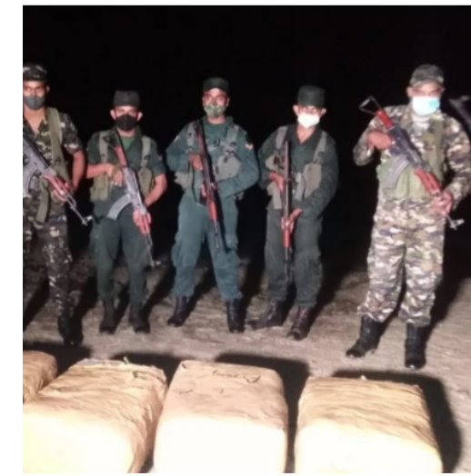
யாழ் தொண்டைமானாறு பகுதியில் கடத்துவரப்பட்டு மறைத்து வைக்கப்பட்டிருந்த

நிலையில் 120கிலோ கஞ்சா இராணுவத்தினரால் மீட்கப்பட்டுள்ளது. இராணுவத்தினருக்கு கிடைத்த தகவலொன்றின் அடிப்படையில் நடைபெற்ற சுற்றிவளைப்புத் தேடுதல் ஒன்றின் போது கடற்கரையில் மறைத்து வைக்கப்பட்டிருந்த கஞ்சா மீட்கப்பட்டுள்ளது. ஆனால் சந்தேக நபர்கள் யாரும் கைது செய்யப்படவில்லை. பின்னர் கைப்பற்றப்பட்ட கஞ்சா நீதிமன்றின் உத்தரவுக்கமைய தீவைத்து அழிக்கப்பட்டது. அண்மைக்காலமாக யாழில் போதைப்பொருட்கள் கைப்பற்றப்படும் சம்பவங்கள் அதிகரித்துள்ளமை குறிப்பிடத்தக்கது