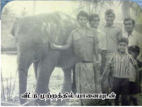
வீட்டு முற்றத்தில் யானையுடன்