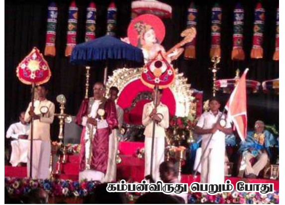
கம்பன்விருது பெறும் போது

இவர்தம் சொற்பொழிவுகள் கேட்போரை மெய்மறக்கச்செய்து பெருமித உணர்வைத் தோற்றுவிக்கும் தன்மையின. அத்திறமை காரணமாக பல விருதுகளைத் தனகத்தே கொண்டுள்ளவர்.