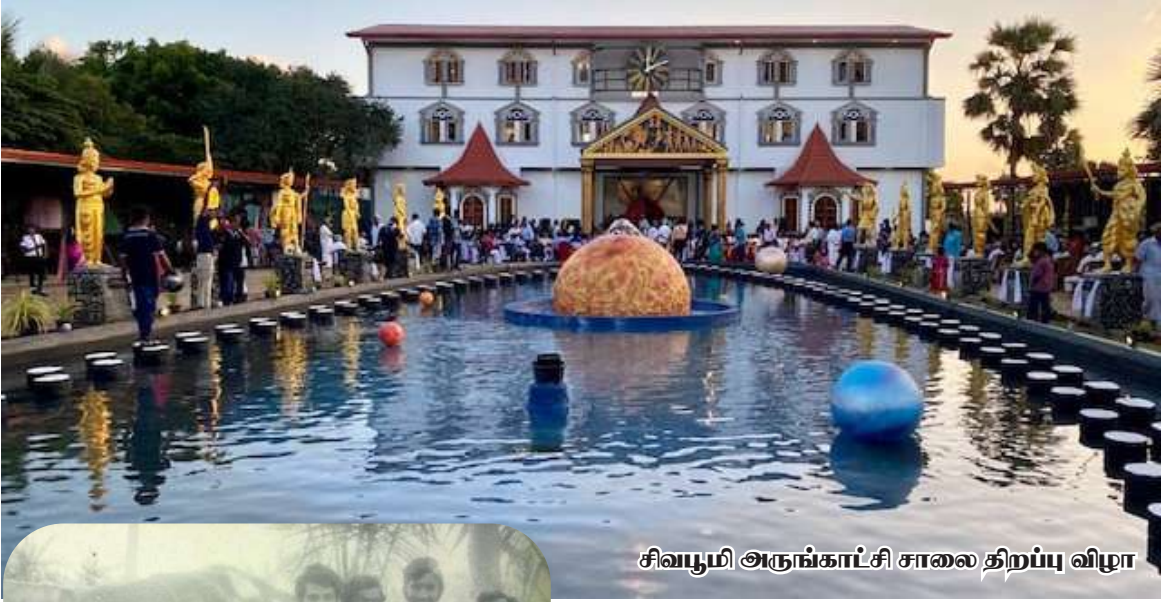
சிவபூமி அருங்காட்சி சாலை திறப்பு விழா