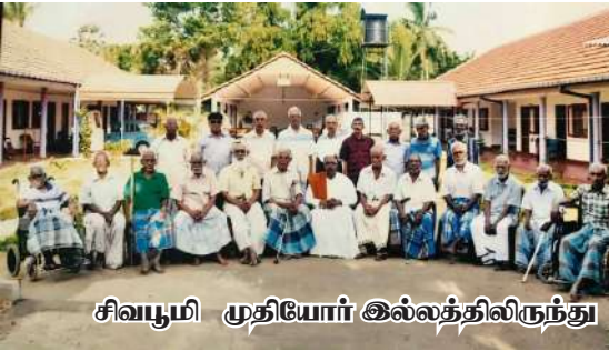
சிவபூமி முதியோர் இல்லத்திலிருந்து

பணிகளை திறம்பட ஆற்றி வருபவரும் தொண்டின் திருவுருவமாக விளங்குபவரே செஞ்சொல் அரசு ஐயா அவர்கள்.