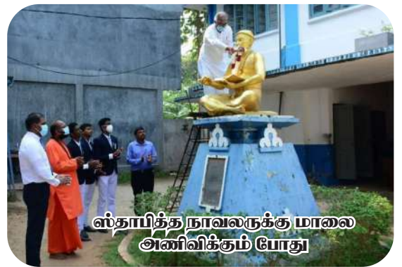
ஸ்தாபித்த நாவலருக்கு மாலை அணிவிக்கும் போது

களுடனும் தொடர்பு கொண்டு பணியாற்ற வேண்டும் என்பதை எடுத்து காட்டுவது மட்டுமன்றி கதியற்றோருக்கு புகலிடமாகவும் ஏழைகளின் கண்ணீர் துடைக் கும் கருணை இல்லமாகவும் அமைய வேண்டும் என்கின்ற சிந்தனை வேருன்றப் பெற்றவர் இவர்.