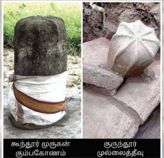
கூந்தூர் முருகன் கும்பகோணம்

ஆனால்பக்தபிரகலாதன் கூறியபோது “நரசிம்மர்” தூணிலிருந்து வெளிவந்தது போல, அகழ்வராச்சியின் போது குருந்தூர் மலையின் ஈசன் எண்முக தாரா வடிவில் வந்து நொந்துபோய்க் கிடந்த தமிழர் நெஞ்சங்களுக்கு பால்வார்த்தான் என்பதனை எண்ணும் போதெல்லாம், “தென்னாடுடைய சிவனே போற்றி; எந் நாட்டவர்க்கும் இறைவா போற்றி” என்றே மனம் தியானிக்கிறது.