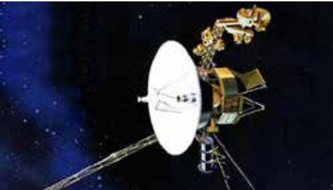
நாஸாவனால் 1977 இல் அனுப்பப்பட்ட

இதை எல்லாம் ஆராய்ந்தபின்னர்தான் செவ்வாய்க் கிரகத்திலே குடியேறத் தீர்மானித்து