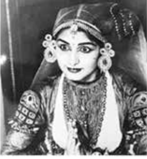
ஒரு கதகளி கலைஞர்