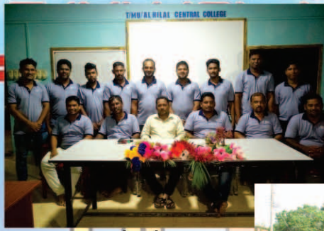
பழைய மாணவர் சங்க அங்கத்தவர்கள்