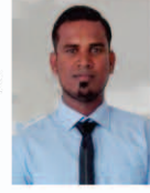
FM. ANEES Member