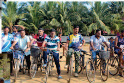
வைரவிழாவை முன்னிட்டு சைக்கிள் ஓட்டப்போட்டி