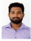
HM. AZAM Member