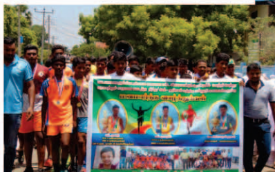
மெய்வல்லுனர் விளையாட்டுப்போட்டியின் சாதனை வீரர்களுக்கான உதர்வலம்