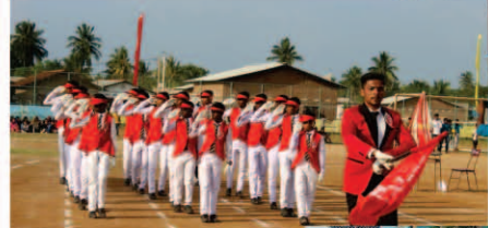
மாணவர் அணிவகுப்பு இஸ்ல விளையாட்டுப்போட்டி நிகழ்வு - 2019