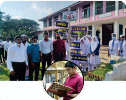
Direction Board & Name Board கையளிப்பு

காற்றால் மழையால் கதிரொளியால் காலச் சுழற்சியில் எமைகாக்கும் ஏற்றம் பெற்ற உணையன்றி ஏகன் வேறு எமக்கில்லை !!