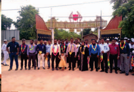
ஆசிரியர் தின நிகழ்வு - 2019