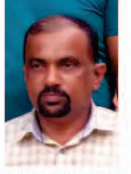
MS. GAZZALY Member