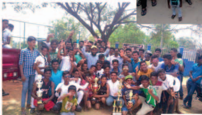
வட்டார விளையாட்டுப் போட்டியின் சாதனை - 2019