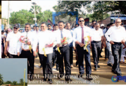
இஸ்ல விளையாட்டுப்போட்டி நிகழ்வு - 2019