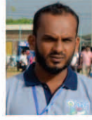
MM. AMEEN Member