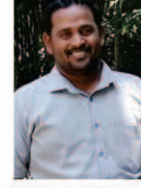
CBA. BASITH Member