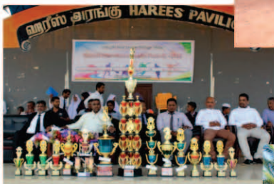
ஹிலாலியன் பிரீமியர் லீக் கிரிக்கெட் இறுதிப்போட்டி - 2019