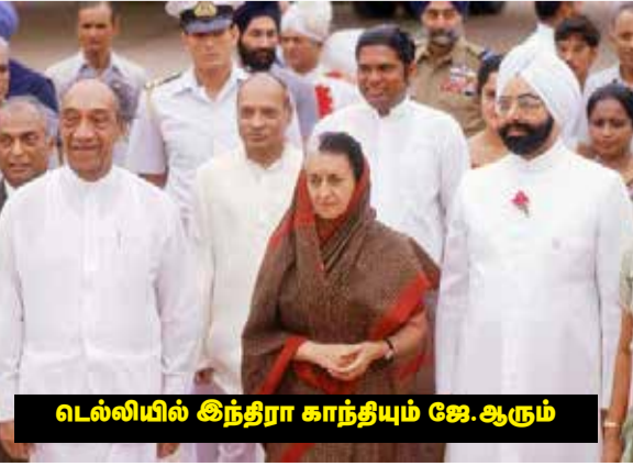
டெல்லியில் இந்திரா காந்தியும் ஜே.ஆரும்

இந்த பேச்சுவார்த்தையினை மையப்படுத்தி ஜே.ஆரின் தியேரையும் ஆணவத்தையும் பல சர்வதேச பத்திரிகைகள் விமரிசித்தன. லண்டனில் இருந்து வெளியவரும் 'ரைம்ஸ்' (Times - London) அதன் 3 ஆவது இதழில் இப்படி தலையங்கம் தீட்டி வெளியிட்டது.