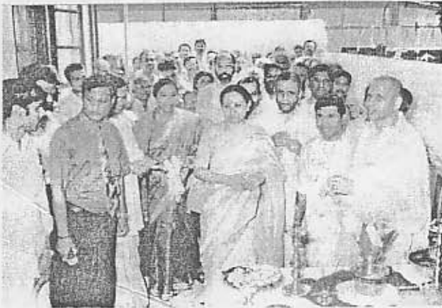
விழாவுக்கு வருகைதந்த விருந்தினர்கள் வரவேற்கப்படுகிறார்கள்.