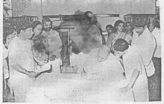
கொழும்பு இராமகிருஷ்ண மிஷன் தலைவர், விடுதி மாணவர் சேர்வுப் பதிலேட்டை ஆரம்பித்துவைக்கிறார்.