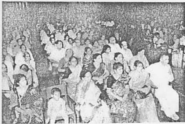
இன்னிசைக் கச்சேரியின்போது சமூகமளித்திருந்த ரசிகப் பெருமக்களில் ஒரு பகுதியினர்.