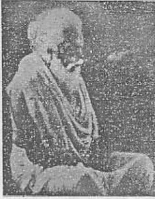
அன்பான அடியார்களே !