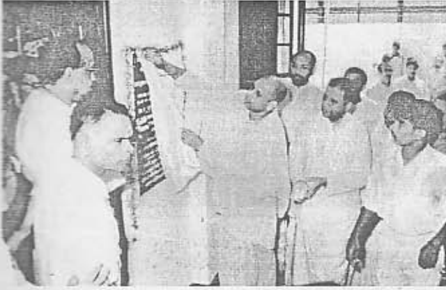
கொழும்பு இராமகிருஷ்ண மிஷன் தலைவர் திரைநீக்கம் செய்து விடுதியைத் திறந்து வைக்கிறார்.

கொழும்பு இந்துக் கல்லூரி, இரத்தமலாளை- மாணவர் விடுதி திறப்பு விழா நிகழ்ச்சிகள் சில.