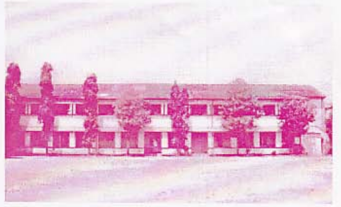
இரத்மலாணை - கொழும்பு இந்துக் கல்லூரியின் முகப்புத் தோற்றம்