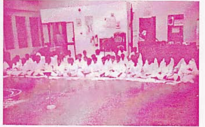
யாமன்ற சிவராத்திரி விழாவில் இரத்மலாணை கொழும்பு இந்துக் கல்லூரி மாணவர்கள் கூட்டுப் பிரார்த்தனை செய்கிறார்கள்.