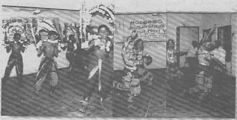
அறநெறிப் பாடசாலை மாணவர்களின் காவடி நிகழ்ச்சியையும் , பரத நாட்டிய நிகழ்ச்சியையும் படத்தில் காணலாம்.