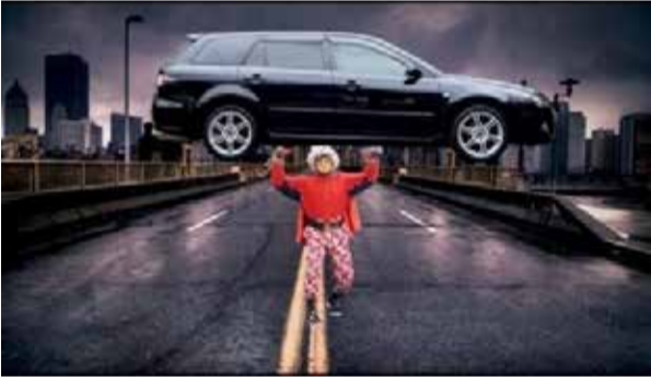
மகிழ்வூட்டும் நேரலை நிகழ்ச்சி

பகல் 1.00 மணி : மழலைகள் நேரம் ( மறு ஒளிபரப்பு ) 1.30 மணி : சுப்பர் சீன்ஸ்-நாய்கள் யாக்கிருதை, முண்டாசுபட்டி திரைப்படக் காட்சிகள் 4.30 மணி : குட்டிஸ் தர்பார்-சிறுவர்களை