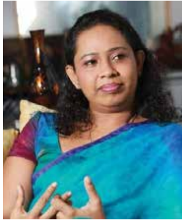
அரசாங்கத்தின் நோக்கம் என்றும் இராஜாங்க அமைச்சர் பேராசிரியர் சன்ன ஜயசுமண தெரிவித்துள்ளார்.

இதேவேளை, தடுப்பூசித் திட்டம் அரசியல் மயமாக்கப்படாமல் மேற்கொள்ளப்பட்டு வருவதாகவும் நாட்டில் உள்ள அனைவருக்கும் விரைவில் தடுப்பூசி செலுத்துவதே