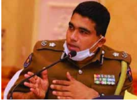
இந்தச் சம்பவத்தை தொடர்ந்து சந்தேகநபரைக் கைதுசெய்த பாணந்துறை - வடக்கு பொலிஸ் நிலையத்தைச் சேர்ந்த உப பொலிஸ்