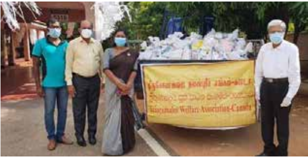
(ஹஸ்பர் ஏ ஹலீம்)

தம்பலகாமம் பிரதேச செயலாளரது வேண்டுகோளுக்கு