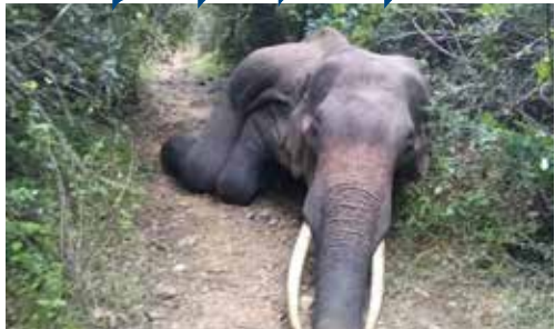
(ஹஸ்பர் ஏ ஹலீம்)

தம்பலகாமம் பொலிஸ் பிரிவுக்குட்பட்ட கல்மெட்டியாவ வடக்கு ஈச்சங்குளம் காட்டுப் பகுதியை அண்டிய பகுதியில் யானை ஒன்று இறந்து கிடப்பதாக நேற்று மாலை பொலிஸார் தெரிவித்தனர்.