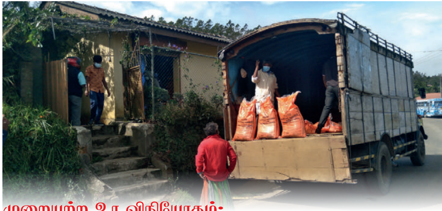
முறையற்ற உர விநியோகம்;