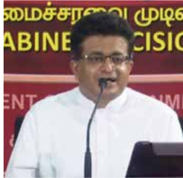
எரிபொருள் விலையை உறுதிப்படுத்த அமைச்சரவை அங்கீகாரம்

வழங்கிய எரிபொருள் நிதியம் செயற்படுத்தப்படவில்லை என அமைச்சர் உதய கம்மன்பில தெரிவித்துள்ளார்.