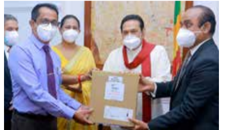
நன்கொடை மூலம் இதற்கான ஏற்பாட்டைச் செய்து கொடுத்தார்.

பிரதமர் தமக்குக் கீழ் இயங்கும் மக்கள் வங்கியின் 'பீப்பிள்ஸ் லீசிங்' நிறுவன