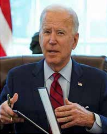
பொறுப்பேற்றபோது நமது நாடு நெருக்கடியான காலகட்டத்தில் இருந்தது. 150 நாட்களுக்கு முன்

இந்நிலையில், அமெரிக்க அதிபர் ஜோ-பைடன் வெளியிட்டுள்ள அறிவிப்பில், அமெரிக்காவில் 150 நாள்களில் 30 கோடி கொரோனாத் தடுப்பூசி டோஸ்கள் செலுத்தப்பட்டுள்ளன. ஆனால், நான் ஆட்சி