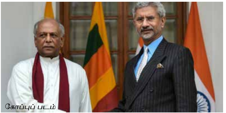
கருத்துக்களைப் பரிமாறிக் கொண்டனர். கொழும்பு துறைமுக நக ரத் திட்டத்தின் மூலமாக இலங் கையில் சீனாவின் ஆதிக்க ம் அதிகரித்துவருவது

புதுடில்லி, ஜூன் 22 இந்திய வெளிவிவகார அமைச்சர் எஸ். ஜெய்சங்கர், இலங்கை வெளிவிவகார அமைச்சர் தினேஷ் குணவர்த்த னவுடன் விரிவான பேச்சுக் களை நேற்று திங்கட்கிழமை நடத்தினார் என பி.ரி.ஐ. செய் திச் சேவை நேற்றிரவு தெரி வித்தது. இணையத் தொழில்நுட்பத் தின் ஊடாக மெய்நிகர் சந்திப் பாக இது இடம்பெற்றது. இதன்போது இரு தரப்பு உறவு கள், பிராந்திய விவகாரங்கள் தொடர்பில் இருவரும்