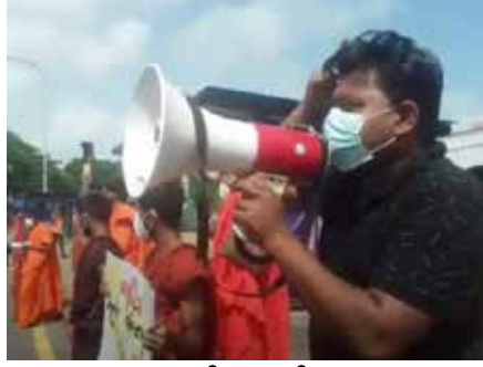
களைப் பின்பற்றி, ஆர்ப்பாட்டத்தில் ஈடுபட்டனர் என்று பல்கலைக்கழக மாணவர்கள் தெரிவித்தனர். (இ)

அமைதியின்மை ஏற்பட்டது. கொரோனா வழிகாட்டல்களின் கீழ், பொதுமக்கள் ஒன்றுகூடல்கள் தடை செய்யப்பட்டுள்ள நிலையிலேயே, இந்த ஆர்ப்பாட்டம் மேற்கொள்ளப்பட்டது. தாம் சுகாதார வழிகாட்டல்