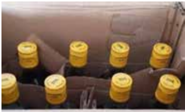
நாட்டில் பயணத் தடை நடைமுறைக்கு வந்த நிலையில், ஒரு மாத காலத்தின் பின்னர் நேற்று மதுபானசாலைகள் திறக்கப்பட்டன. இதன்போது, 10இற்கும் அதிகமான மதுபானப் போத்

யாழ்ப்பாணம், ஜூன் 22 யாழ்ப்பாணம் மாவட்டத்தில் சட்டத்தால் கூறப்பட்ட அளவைவிட அதிகளவான மதுபானப் போத்தல்களை வைத்திருந்த குற்றச்சாட்டில் ஐவர் நேற்று கைதுசெய்யப்பட்டனர். யாழ்ப்பாணம் மாவட்ட பொலிஸ் புலனாய்வுப் பிரிவினரால் கைதுசெய்யப்பட்ட இவர்களிடம் இருந்து 90 மதுபான போத்தல்கள் கைப்பற்றப்பட்டன என்று பொலிஸார் தெரிவித்துள்ளனர். கடந்த மாதம் 21ஆம் திகதி