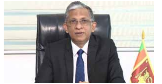
அதிகபட்சம் இரண்டு நாட்கள் அலுவலகத்திற்கு அனுமதிக்க முடியும்.

அத்தியாவசியமற்ற சேவைகளின் கீழ் வரும் அரசு மற்றும் தனியார் நிறுவனங்கள் தமது ஊழியர்களையும் அதிகாரிகளையும் வாரத்திற்கு