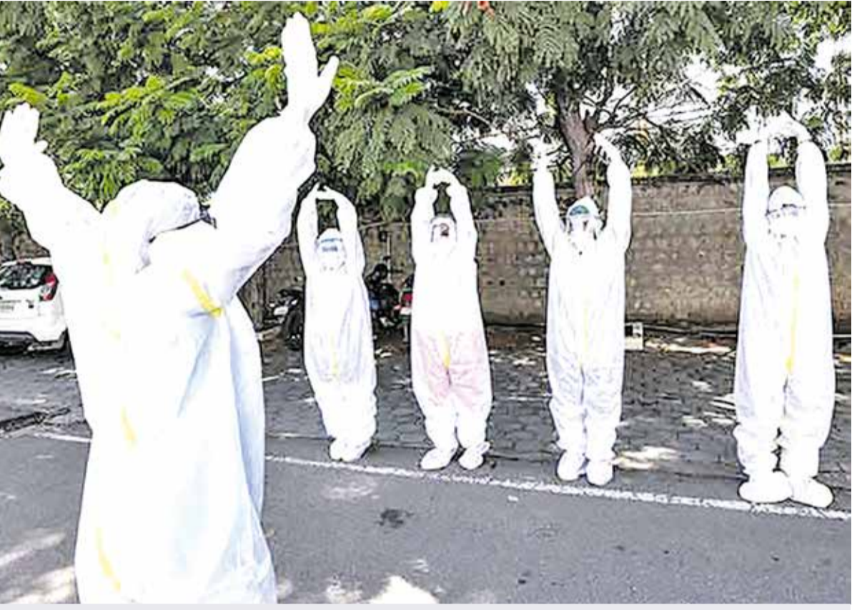
சர்வதேச யோகா தினம் 2021 சர்வதேச யோகா தினமான நேற்று கோவையில் கொரோனா நோயாளிகள் முழு கவச உடை அணிந்தபடி யோகா பயிற்சியில் ஈடுபட்டிருந்தபோது....