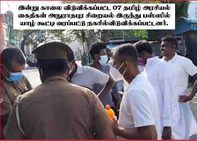
இன்று காலை விடுவிக்கப்பட்ட 07 தமிழ் அரசியல் கைதிகள் அநுராதபுர சிறையல் இருந்து பஸ்ஸில் யாழ் கூட்டி வரப்பட்டு நகரில் விடுவிக்கப்பட்டனர்.

பொசன் பூரணை தினத்தில் ஜனாதிபதி பொதுமன்னிப்பு