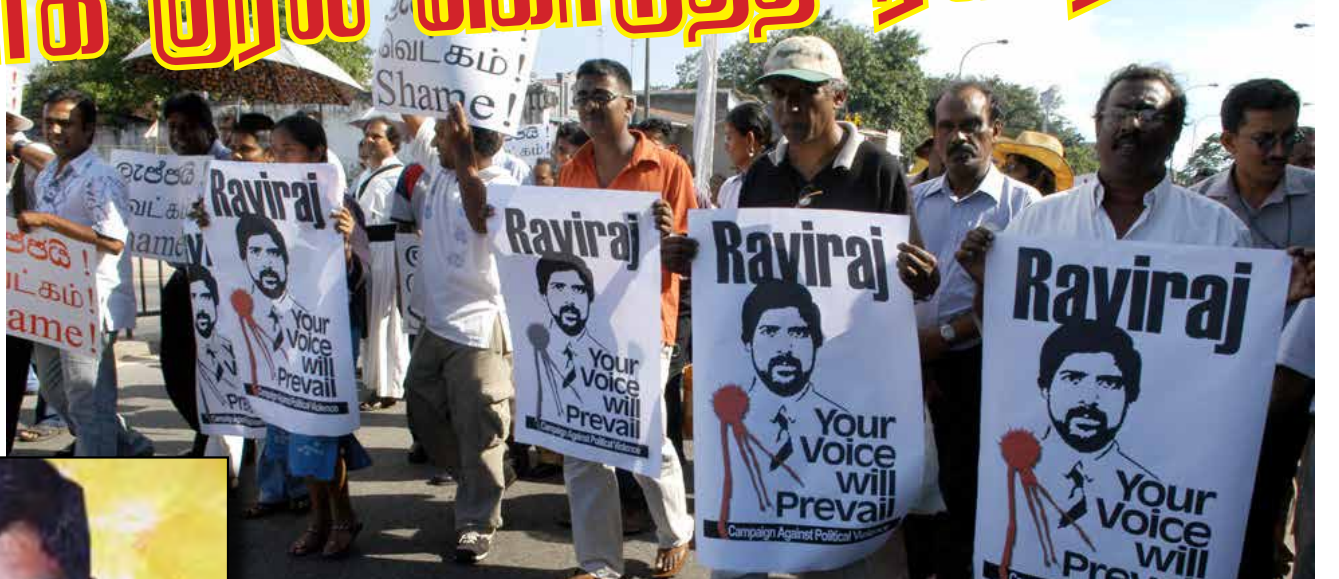
மாமனிதர் ரவிராஜ் அவர்களின் 59 ஆவது ஜனன தினத்தைவொட்டிய நினைவுப் பதிவு

பின்னர் 2001 டிசம்பர் மாதம் நடந்த பொதுத் தேர்தலில் போட்டியிட்ட அவர், பாராளுமன்றத்துக்கு தனது 39வது வயதில் காலடி பதித்தார். நாடாளுமன்ற இளம் உறுப்பினரான அவர், தமிழ், ஆங்கிலம், சிங்களம் ஆகிய மொழிகளில் தான் கொண்ட புலமை ஊடாக தமிழ் மக்களுக்கு எதிரான கொடுங்களை பாராளுமன்றத்திலும் சர்வதேச மட்டத்திலும் புட்டுப்பட்டு