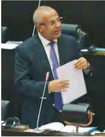
வழிகளையும் கண்டறிய வேண்டும் என்றார்.

மாற்று வழிவகைகளைத் தேடுவதற்கு முன்னர் கள நிலவரத்தின் யதார்த்தத்தைப் பற்றிச் சிந்தியுங்கள். மத்திய வங்கியின் 2020ஆம் ஆண்டு ஆண்டறிக்கையின் பிரகாரம் ஏற்றுமதி பெறுமதி எல்லாமாக 9.8பில்லியன் ஆகும். அதில் ஐரோப்பிய ஒன்றியம் எங்களது மொத்த ஏற்றுமதியில் 31.6 வீதத்தைக் கொள்வனவு செய்கின்றது. அது அமெரிக்க டொலர் 3.1பில்லியன் பெறுமதியானது. ஐக்கிய அமெரிக்கா எங்களது ஏற்றுமதியில் 24.9 வீதத்தைக் கொள்வனவு செய்கின்றது. அது அமெரிக்க டொலர் 2.5 பில்லியனுக்கு சமமானது. மத்திய கிழக்கு நாடுகள் எங்களது ஏற்றுமதியில் 9.1 வீதத்தைக் கொள்வனவு செய்கின்றன. அது 900 மில்லியன் அமெரிக்க டொலர் பெறுமதியானது. இந்தியா எங்களது மொத்த ஏற்றுமதியில் 6 வீதத்தைக் கொள்வனவு செய்கின்றது. அது 606 மில்லியன் அமெரிக்க டொலர் பெறுமதியானது. இவ்வாறான எல்லா நாடுகளையும் ஒன்றாகச் சேர்த்து