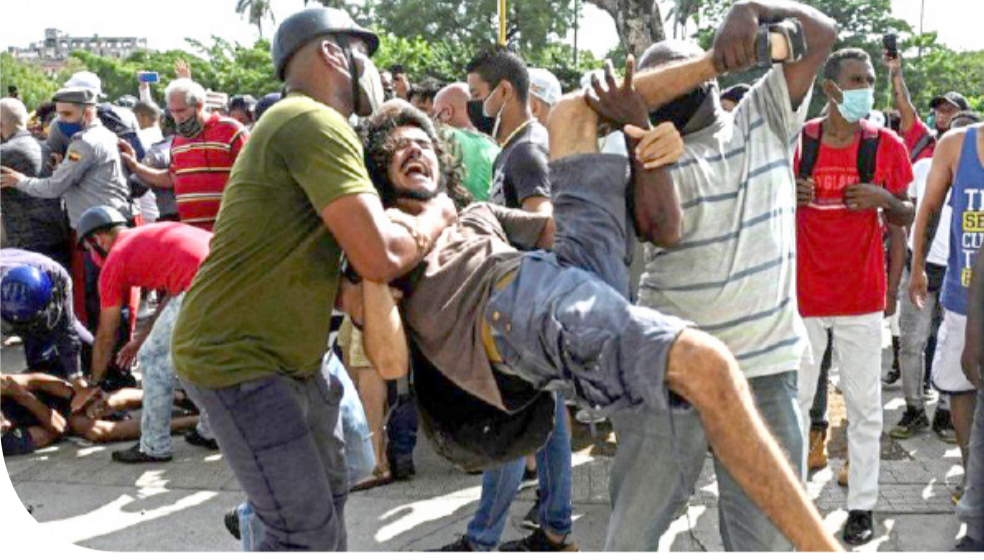
போராட்டக்காரர்கள் சிலரைப் பாதுகாப்புப் படையினர் இழுத்துச் சென்றனர்