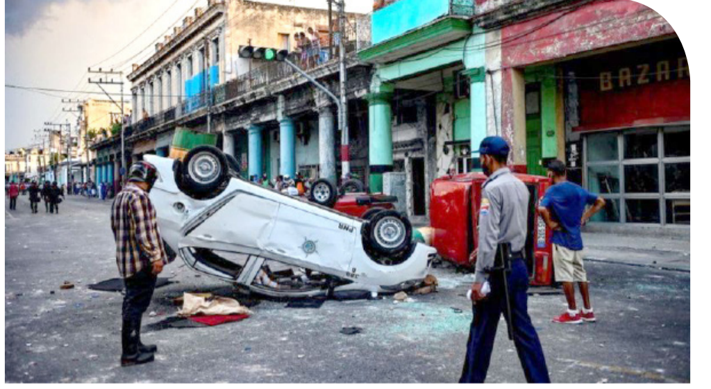
பல இடங்களில் போராட்டக்காரர்கள் வாகனங்களைக் கவிழ்த்தனர், கடைகளை உடைத்தனர்