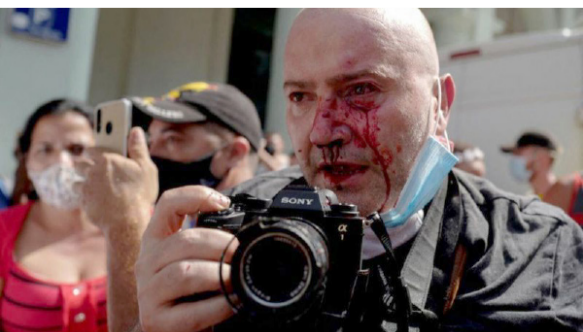
போராட்டத்தின்போது அசோசியேட்டட் பிரஸ் நிறுவனத்தின் புகைப்படக் கலைஞருக்கு காயம் ஏற்பட்டது

இதைத் தவிர கடுமையான மின்வெட்டும், மக்களை அதிருப்தியின் உச்சத்திற்கு அழைத்து சென்றுள்ளது. இதன் காரணமாக ஆயிரக்கணக்கான மக்கள் போராட்டக் களத்தை தேர்ந்தெடுத்துள்ளனர். கியூபா மீதான அமெரிக்காவின் 60 ஆண்டுகால தடை காரணமாக (15 ஆம் பக்கம் பார்க்க)