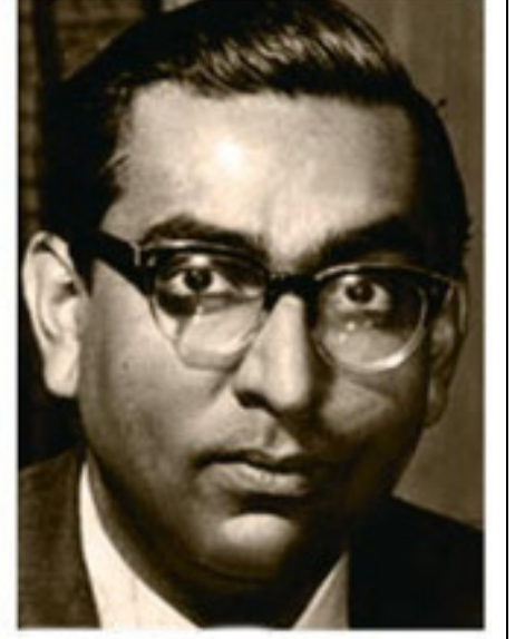
Felix Dias R. Bandaranaike

சுதந்திரமடைந்து 15 ஆண்டுகள் கூட முடிந்திராத காலம் அது! அப்போதிருந்த ஜனநாயக ஆட்சியைக் கவிழ்த்து ஆட்சி அதிகாரத்தை தம் வசப்படுத்திக் கொள்வதற்காக இராணுவத்திலிருந்த சிலரும் காவல்துறையிலிருந்த சிலரும் கூட்டாக முயன்ற அந்தச் சதி, முறியடிக்கப்பட்டது. இலங்கையின் அரசியல் வரலாற்றில், அதிர்வு மிக்க பக்கமாக இருக்கின்றது. 1962 ஆம் ஆண்டில் நடைபெற்ற இக்கதையை நீங்கள் அறிவீர்களா?