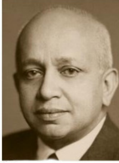
Sir Oliver Goonatillake