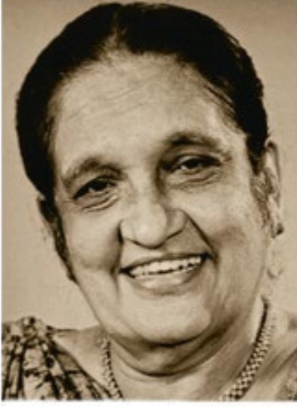
Mrs. Sirimavo Bandaranaike