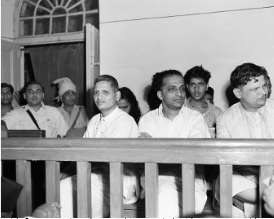
காந்தி கொலை வழக்கு விசாரணையில் நாதுராம் கோட்சே, நாராயண ஆப்தே

காந்தியை மாபெரும் அசைக்க முடியாத இடத்துக்கு கொண்டு செல்லும் என்பதை கோட்சே எதிர்பார்த்திருக்கவில்லை.