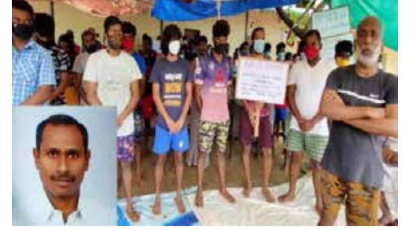
கொலை செய்து விடுங்கள் என்று கோரி போராட்டம் நடத்திவருகின்றனர்.

அந்த வழக்கிலும் தண்டணைக் காலம் முடிந்து சிறையில் அடைத்துள்ளனர். பிணை கிடைத்தாலும் வேறு வழக்கில் கைது செய்து சிறையில் அடைக்கின்றனர். எனவே, சட்டப்படி விடுதலை செய்ய வேண்டும். இல்லையென்றால் கருணைக்