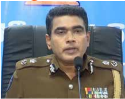
தனிமைப்படுத்தல் சட்ட விதிமுறை