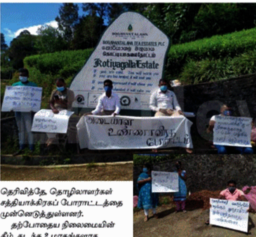
தெரிவித்தே, தொழிலாளர்கள் சத்தியாக்கிரகப் போராட்டத்தை முன்னெடுத்துள்ளனர். தற்போதைய நிலைமையின் கீழ், கடந்த 2 மாதங்களாக தோட்ட நிர்வாகத்தால் தொழிலாளர்கள் பல அழுத்தங்களுக்கு உள்ளாவதாகவும் 18 கிலோ கிராம் கொழுந்தை தினமும் பறிக்காமையால் தமது கொடுப்பனவுகள்

பொகவந்தலாவ பெருந்தோட்ட நிறுவனத்துக்குரிய கொட்டியாகல தோட்டத் தொழிலாளர்கள், அத்தோட்ட நிர்வாகத்துக்கு எதிர்ப்புத் தெரிவித்து, நேற்று (30) காலை தேயிலைத் தொழிற்சாலைக்குச் செல்லும் பிரதான வாயிலை மறித்து, சத்தியாக்கிரகப் போராட்டத்தில் ஈடுபட்டனர். சம்பள நிர்ணய சபையால் தமக்கு அதிகரிக்கப்பட்ட 1,000 ரூபாய் சம்பள அதிகரிப்பை வழங்குவதற்கு, தோட்ட நிர்வாகம் 18 கிலோ கிராம் கொழுந்தைப் பறித்தால் மாத்திரமே வழங்குவதாக அழுத்தம் கொடுப்பதாக அவர்கள் தெரிவித்தனர். அவ்வாறு 18 கிலோ கிராம் கொழுந்தைப் பறிக்காத தொழிலாளர்களால் பறிக்கப்படும் கொழுந்தை, கிலோவொன்று 40 ரூபாய் விலகம் செலுத்த நிர்வாகம் நடவடிக்கை எடுத்துள்ளமைக்கு எதிர்ப்பு