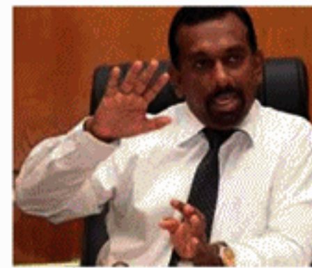
சட்டத்தின்படி, அரிசியை அதிக விலைக்கு விற்பனை செய்வோருக்கு 2 ஆயிரத்து 500 ரூபாய் அபராதம் விதிக்கப்படும். அரிசி ஆலை உரிமையாளர்களால் இந்தத் தொகையை இலகுவாக செலுத்த முடியும். எனவே விவசாய அமைச்சர் என்ற வகையில், இந்த அபராதத் தொகையை ஒரு

அரிசி விலையைக் கட்டுப்படுத்துவதில் அரசாங்கத்துக்கு ஏற்பட்டிருந்த தோல்வியை, சரி செய்வதற்கு நடவடிக்கை எடுக்கப்பட்டுள்ளதாக அமைச்சர் மஹிந்தானந்த அனந்தகமகே தெரிவித்துள்ளார். நெல் சந்தைப்படுத்தல் சபையிடம் இருந்த அரிசி கையிருப்பு தீர்ந்துள்ள நிலையில், அரிசி ஆலை உரிமையாளர்கள் 80 - 90 ரூபாய்க்கு அரிசி கிலோ கிராம் ஒன்றைக் கொண்டுவரவு செய்து, அவற்றை 240 ரூபாய்க்கு விற்கப்பட்டு வந்ததை, அரிசி ஆலை உரிமையாளர்களால் இந்தத் தொகையை இலகுவாக செலுத்த முடியும். எனவே விவசாய அமைச்சர் என்ற வகையில், இந்த அபராதத் தொகையை ஒரு