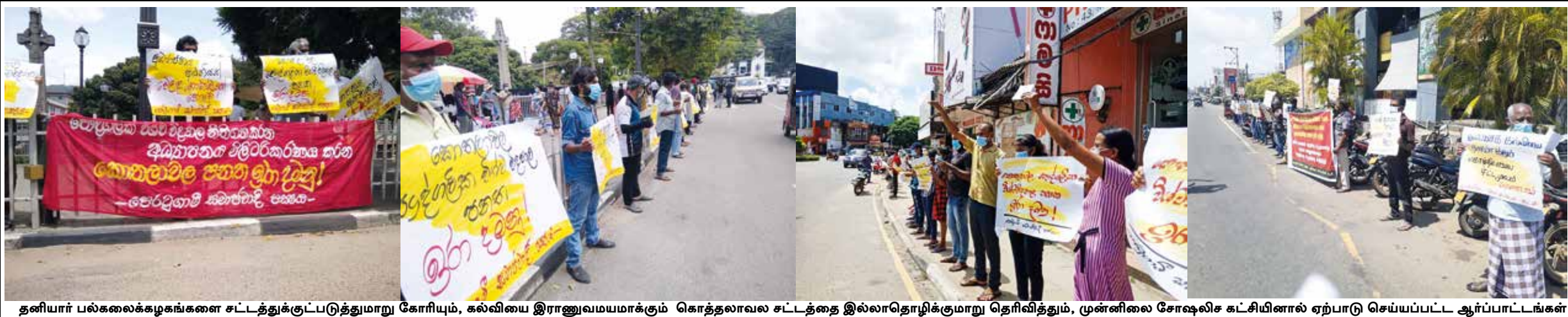
தனியார் பல்கலைக்கழகங்களை சட்டத்துக்குட்படுத்துமாறு கோரியும், கல்வியை இராணுவமயமாக்கும் கொத்தலாவல் சட்டத்தை இல்லாதொழிக்கமாறு தெரிவித்தும், முன்னிலை சோஷலிச கட்சியினால் ஏற்பாடு செய்யப்பட்ட ஆர்ப்பாட்டங்கள் நேற்று கண்டி, பொலன்னறுவை, கதுருவல மற்றும் தங்கல்லை ஆகிய பிரதேசங்களில் இடம்பெற்றன.

தனிமைப்படுத்தல் சட்டத்தை மீறியமை தொடர்பில் நேற்றுக் காலை வரையான 24 மணித்தியாலத்தில் 455 பேர் கைதுசெய்யப்பட்டுள்ளதாக பொலிஸ் ஊடகப் பேச்சாளரும், சிரஷ்ட பிரதி பொலிஸ்மா அதிபருமான அஜித் ரோஹன தெரிவித்துள்ளார். இதுதொடர்பில் அவர் மேலும் குறிப்பிட்டுள்ளதாகவது, பயணக் கட்டுப்பாடு நீக்கப்பட்டிருக்கின்ற போதிலும் மக்கள் தனிமைப்படுத்தல் சட்டங்களுக்குட்பட்டிருக்க வேண்டும். இது தொடர்பான நடைமுறைகள் சுகாதார சேவைகள் பணிப்பாளரினால் கடந்த 20 ஆம் திகதி வெளியிடப்பட்டன. அதனடிப்படையில் இதுவரையில் தனிமைப்படுத்தல் சட்டத்தை மீறியமை தொடர்பில் 45 ஆயிரத்து 99 பேர் கைதுசெய்யப்பட்டுள்ளதாகவும் அவர் தெரிவித்துள்ளார்.