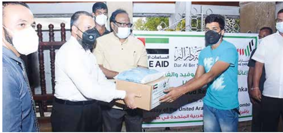
(அஷ்ரப் ஏ சமந்த)

கொழும்பிலுள்ள ஐக்கிய அரபு எமிரேட்ஸ் தூதரகத்தினால் வழங்கப்பட்ட உலருணவுப் பொதிகள் அமைச்சர் சரத் வீரசேகர மற்றும் அமைச்சர் ரோஹித்த அபேகூணவர்தன ஆகியோரினால் கொவிட்-19 தொற்றுப்பரவல் மற்றும் வெள்ளத்தினால் பாதிக்கப்பட்ட மக்களிடம் கையளிக்கப்பட்டன.