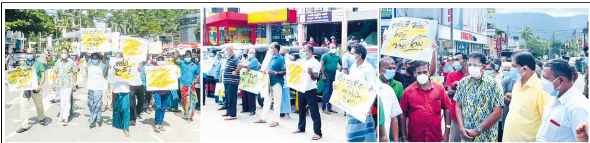
தேயிலை செடிகளுக்கான உரத்தைப் பெற்றுக்கொடுக்குமாறு கோரி நெலுவ பிரதேசத்தில் நேற்று சிறு தேயிலைத் தோட்ட உரிமையாளர்கள் ஆர்ப்பாட்டமொன்றை முன்னெடுத்திருந்தனர். இந்த ஆர்ப்பாட்டத்தில் ஐக்கிய மக்கள் சக்தியின் நாடாளுமன்ற உறுப்பினர் கயந்த கருணாதிலக்கவும் கலந்துகொண்டார்.

எதிர்வரும் 30ஆம் திகதிவரை இடம்பெறவுள்ள இந்த பல பரபரப்பு கடற்படை கூட்டுப் பயிற்சி, சுகாதார வழிமுறைகளுக்கமைய முன்னெடுக்கப்படுகின்றதாக கடற்படை உறுதிப்படுத்தியுள்ளது.