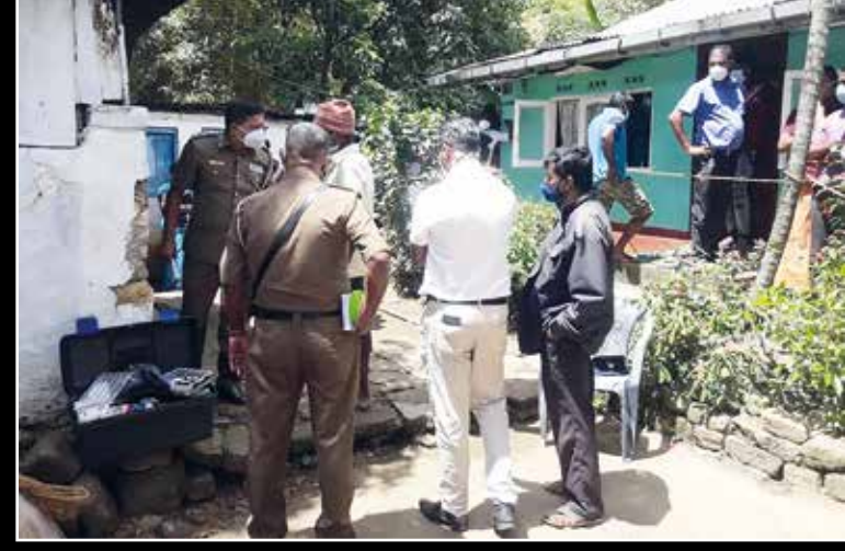
(பூண்டலோயா செய்தியாளர்) பூண்டலோயா பொலிஸ் பிரிவிற்குட்பட்ட பழையதோட்டம் பகுதியில்

படுகொலை செய்ததாக சந்தேகத்தில் இளைஞர் கைது