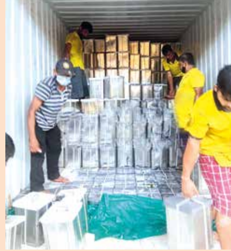
அந்தக் கொள்கலன் சுங்கப்பிரிவினரால் விடுவிக்கப்பட்டிருக்குமாயின் அரசுக்கு 1.3