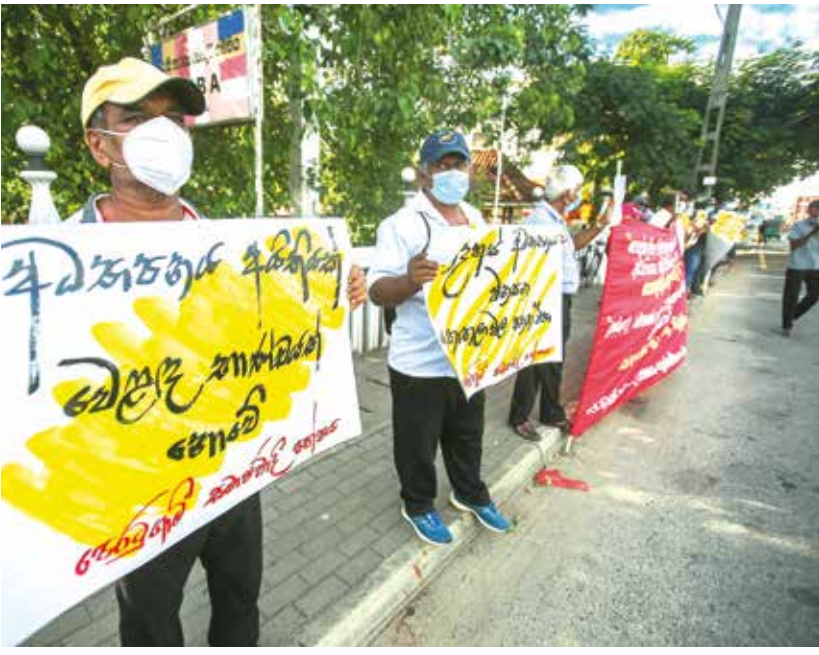
தனியார் பல்கலைக்கழகங்களை சட்டமயமாக்குதல், கல்வித்துறையை இராணுவமயமாக்கும் கொத்தலாவல சட்டமூலத்தை கைவிடுமாறு கோரி கிரிபத்தகொடையில் முன்னிலை சோஷலிச கட்சியினர் நேற்று ஆர்ப்பாட்டத்தில் ஈடுபட்டனர்.