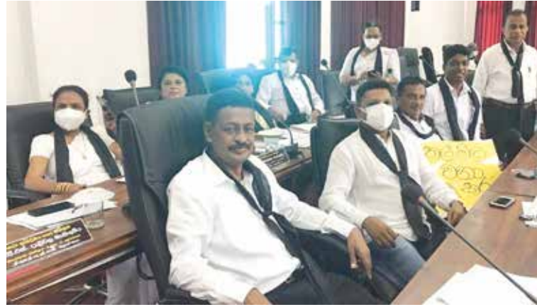
(கண்டி செய்தியாளர்) எரியொருள் விலையேற்றத்திற்கு எதிர்ப்புத் தெரிவித்தும், எரியொருள் விலையைக் குறைக்க வேண்டும் என்றும் கோரிக்கை

விடுத்தும் யட்டிநுவர பிரதேச சபை எதிர்க்கட்சி அங்கத்தினர்கள் எதிர்ப்பு ஆர்ப்பாட்டம் ஒன்றை நேற்று முன்தினம் மேற்கொண்டனர். இவர்கள் மாதாந்தக் கூட்டத்திற்கு வருகை