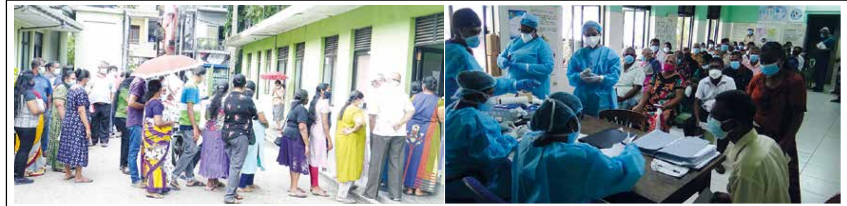
இந்தியாவின் கொவிஷ்ட் தடுப்பூசிகள் வழங்கப்பட்டவர்களுக்கு ஜிந்துப்பிட்டி அரசு வைத்தியசாலையில் பி.சி.ஆர். மற்றும் அன்ரிஜன் பரிசோதனைகள் நேற்று முன்தினம் மேற்கொள்ளப்பட்டன.

இவ்வாறு காட்டு யானை தாக்கலுக்குள்ளான பெண், வீட்டில் தனியாக இருந்துள்ளதன் நேற்றுக் காலை 4 மணியளவில் வீட்டிலிருந்து வெளியே வந்துள்ளார். அந்தச் சந்தர்ப்பத்தில் அவர் இவ்வாறு யானையால் தாக்கப்பட்டுள்ளதாக பொலிஸார் தெரிவித்தனர். தாக்குதலுக்குள்ளான பெண் சம்பவ இடத்திலேயே உயிரிழந்துள்ளார்.