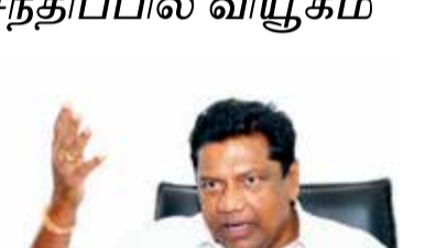
அரசியல் இயக்கம் பற்றி பேசப்பட்டுள்ளது எனவும், பல தரப்புகள் இணையக்கூடும் எனவும் குமார வெல்கம தரப்பு குறிப்பிட்டுள்ளது. இதேவேளை, புதியதோர் அரசியல் அணியை உருவாக்கினால்கூட குமார வெல்கம தம்முடனேயே பயணிப்பார் என்று சஜித் அணி நம்பிக்கை வெளியிட்டுள்ளது. (இ)

எனவே வெளியிட்டிருந்தார் என்பது குறிப்பிடத்தக்கது. ராஜபக்ஷ கூட்டணியிலிருந்து வெளியேறிய குமார வெல்கம, கடந்த ஜனாதிபதித் தேர்தலின்போது சஜித் பிரேமதாஸவை ஆதரித்ததுடன், பொதுத்தேர்தலில் ஐக்கிய மக்கள் சக்தியின் கீழ் போட்டியிட்டு வெற்றி பெற்றார் என்பதும் குறிப்பிடத்தக்கது. சந்திரிகா அம்மையாரின் பிறந்தநாளையொட்டிய நடைபெற்ற விசேட சந்திப்பின்போதே புதிய