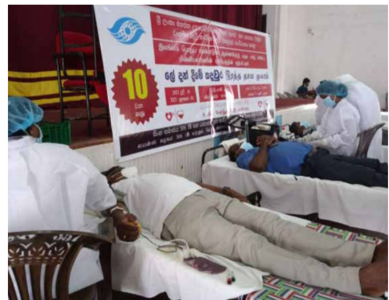
லிருந்து ஆரம்பமாகி இடம்பெற்றது. குறித்த இரத்த தான முகாமில் மின்னியலாளர்கள் உட்பட பொது மக்கள் கலந்துகொண்டனர்.