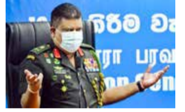
சில்வா தெரிவித்தார். அதன்படி யாழ்ப்பாணம் மாவட்டத்தில் ஊர்காவற்றுறை பொலிஸ் பிரிவுக்குட்பட்ட காரைநகர் கிராம சேவகர் பிரிவில் கள்ளித்தெரு மற்றும் கல்வந்தாழ்வு ஆகிய பகுதிகள்

கொழும்பு, ஜூலை 02 நாட்டில் கொரோனாவின் தீவிரத்தால் மேலும் சில பிரதேசங்கள் நேற்றுக் காலை 6 மணி முதல் மறு அறிவித்தல் வரை தனிமைப்படுத்தப்பட்டுள்ளன. யாழ்ப்பாணம், கண்டி மற்றும் நுவரெலியா ஆகிய மாவட்டங்களைச் சேர்ந்த 4 பிரதேசங்களே இவ்வாறு தனிமைப்படுத்தப்பட்டுள்ளன என்று கொரோனா தடுப்புக்கான தேசிய செயற்பாட்டு மையத்தின் தலைவரும் இராணுவத் தளபதியுமான ஜெனரல் சவேந்திர