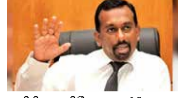
அரிசி ஒரு கிலோவை 98 ரூபாய்க்கும், நாட்டரிசி ஒரு கிலோ 96 ரூபாய்க்கும் விற்பனை செய்யமுடியும் என வர்த்தகத்துறை அமைச்சர் விலை நிர்ணயித்துள்ளார். அதனால்தான் ஒரு கிலோ நெல்லுக்கு 50 ரூபாயை

பச்சை நெல் 44 ரூபாய்க்கும் கொள்வனவு செய்யப்படும். மேற்படி விலைகளே நிர்ணயிக்கப்பட்டன. நெல் சந்தைப்படுத்தும் சபை ஊடாக இன்று முதல் நெல் கொள்வனவு செய்யும் நடவடிக்கை ஆரம்பமாகும். ஏனைய காலப்பகுதிபோல் தாமதம் ஏற்படாது. விவசாயிகளுக்கு உடன் பணம் வழங்குவதற்கான ஏற்பாடும் செய்யப்பட்டுள்ளது. சம்பா மற்றும் கெலுவு