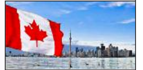
இந்தமொழி தமிழ் மொழியையும் அங்கீகரித்து பாடசாலைகளில் ஒரு பாடமாக பள்ளிகளில் பயல் அனுமதி வழங்கிய கனடா அன்னைவைய வாழ்த்துவோம் வாரீர்

சொத்து சுகம் இழந்து நாமும் இழந்து நீர் நல தானிய எதல்யாய் ஏங்கித் தவித்து ஓடி வந்தோரை ஏற்று உண்ண உணவு உருப்டவை வசதயும் கொடுத்து உயிர் காத்து வாழுவதற்கும் கனடாவின் பிறந்தநாள் இன்று