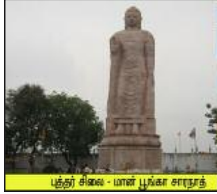
புத்தர் சிலை - மான் பூங்கா சாரநாத்

சௌகந்தி தூபி - கௌதம புத்தர் புத்தகயா என்னும் இடத்தில் ஞானம் அடைந்த பின்னர், தர்மத்தைப் பற்றிய முதல் சொற்பொழிவை தனது சீடர்களுக்கு சாரநாதத்தில் பிரசங்கம் செய்துள்ளார். இந்த நிகழ்ச்சியை நினைவு கூரும் வகையில் 5ஆம் நூற்றாண்டில் குப்தர்களின் ஆட்சிக்காலத்தில் உருவாக்கப்பட்டதுதான் இந்தத் தூபி. இப்பிரபலமான தூபிக்கு அருகில் மியான்மர், ஜப்பான், திபெத் மற்றும் பர்மா நாட்டினர்களால் கட்டப்பட்டுப் பராமரிக்கப்படும் பல புத்த ஆலயங்கள் உள்ளன.