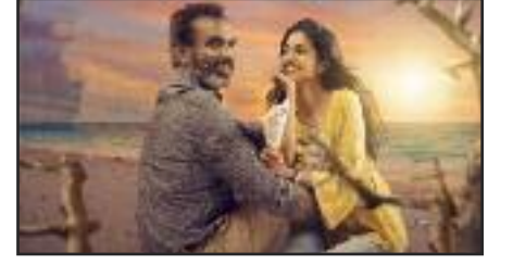
பார்க்கக் கூடிய ஒரு மிகவும் நல்ல படம்.

நினைக்கிறார். பலரால் மதிக்கப்படாமல் புறக்கணிக்கப்படும் கட்டிடப் பாதுகாவலர் அன்பின் அன்பினாலும் மரியாதையாக நடத்தும் விதத்தாலும் இக்கதையில் ஒரு முக்கியமான கதாபாத்திரமாக மாறுகிறார். இவற்றின்மூலம் பட இயக்குனர் சொல்ல வரும் கருத்து என்னவென்று தெரிகிறது. கடைக்குக் காவல் காப்பவரும் மனிதர் தான், அவருக்கும் நாம் மதிப்புக் காட்ட வேண்டும். மற்றவர்களைப் பற்றித் தெரியாமல் அவர்களை அலட்சியம் செய்யக் கூடாது. பொதுவாக நாம் அனைவரிடமும் அன்பு காட்ட வேண்டும்.