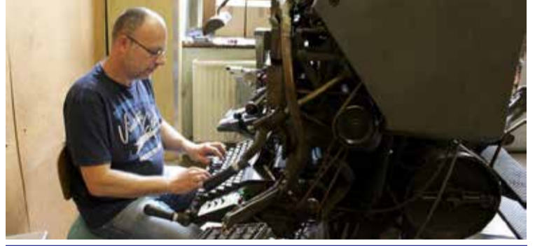
எழுத்துகளை வரி வரியாக அச்சுவரிசையாக்கும் லைனோ இயந்திரம்

சிரேஷ்ட செய்தியாளர்களை விட என் மாத வேதனம் எகிறியது. அந்த நேரத்தில் ரூபா ஆயிரத்து எண்ணூறு, இரண்டாயிரம் என்பது ஓர் எக்ஸ்யூட்டிவ் சம்பளம் போன்றது. பத்திரிகைத் துறையில் சேர்ந்து இரண்டாம் மூன்றாம் மாதமே அந்த நிலையை நான்