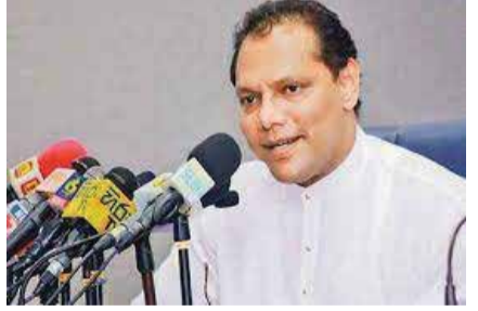
கொண்டார். ஏனென்றால் நாம் அனைவரும் இந்த நெருக்கடியை எதிர்கொள்ள வேண்டும் என்றும் அவர் கூறினார்.

ஸ்ரீ லங்கா பொதுஜன பெரமுனவின் ஸ்தாபகர் பஸில் ராஜபக்ஷ நாடாளுமன்றத்திற்குள் நுழைவதன் மூலம் நாடு எதிர்கொள்ளும் பிரச்சினைகள் தீர்க்கப்படா என இராஜாங்க அமைச்சர் தயாசிறி ஜெயசேகர தெரிவித்தார். பஸில் ராஜபக்ஷ பொறுப்பேற்ற மறுநாளே பிரச்சினைகள் மறைந்துவிடாது என்றும் நாடு பாரிய போராட்டத்தை எதிர்கொண்டு வருவதாகவும் அவர் தெரிவித்தார். நாட்டில் நிலவும் பொருளாதார நெருக்கடியை நிவர்த்தி செய்வதற்கு மக்களும் பங்களிக்க வேண்டுமென அவர் கேட்டுக் கொண்டார். ஏனென்றால் நாம் அனைவரும் இந்த நெருக்கடியை எதிர்கொள்ள வேண்டும் என்றும் அவர் கூறினார்.