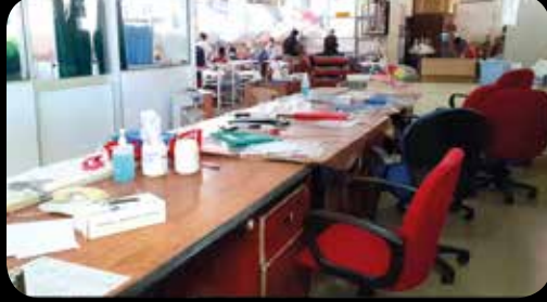
அகில இலங்கை தாதியர் சங்கம் உள்ளிட்ட 3 சங்கங்கள் இணைந்து முன்னெடுத்த 48 மணித்தியால போராட்டத்தால் வைத்தியசாலைக்கு வந்த நோயாளிகள் பல்வேறு அசௌகரியங்களுக்கு முகங்கொடுத்ததை படத்தில் காணலாம்....