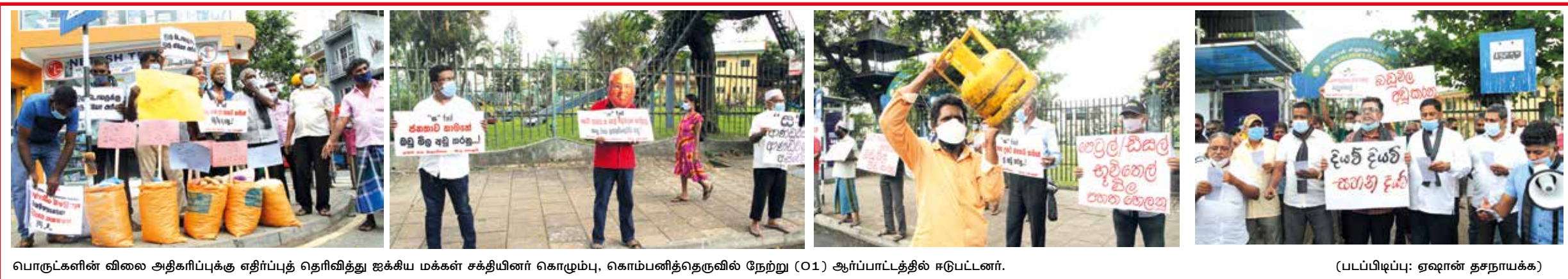
பொருட்களின் விலை அதிகரிப்புக்கு எதிர்ப்புத் தெரிவித்து ஐக்கிய மக்கள் சக்தியினர் கொழும்பு, கொம்பனித்தெருவில் நேற்று (01) ஆர்ப்பாட்டத்தில் ஈடுபட்டனர்.