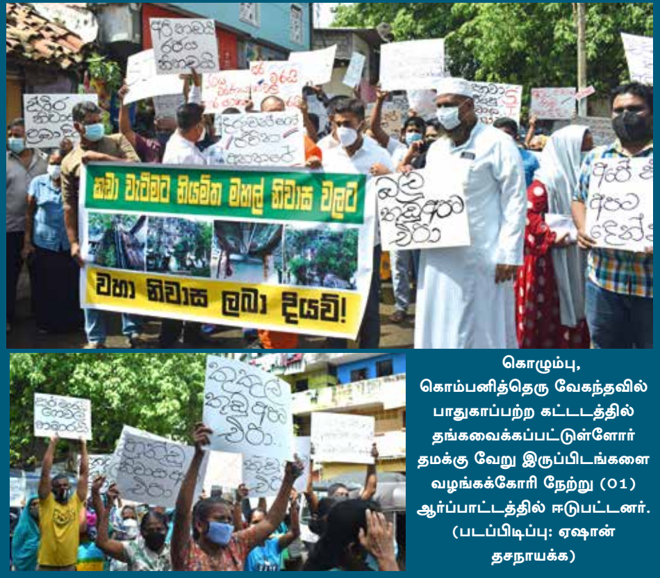
கொழும்பு, கொம்பனித்தெரு வேகந்தவில் பாதுகாப்பற்ற கட்டடத்தில் தங்கவைக்கப்பட்டுள்ளோர் தமக்கு வேறு இருப்பிடங்களை வழங்கக்கோரி நேற்று (01) ஆர்ப்பாட்டத்தில் ஈடுபட்டனர்.