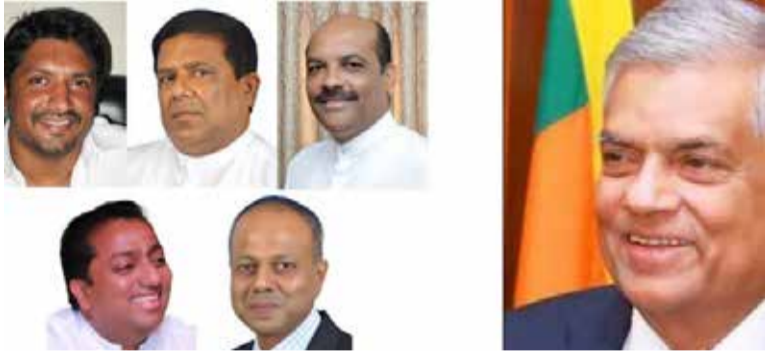
படுத்தல் உள்ளிட்ட விடயங்கள் தொடர்பில் மேற்படி குழு மூன்று மாத காலப்பகுதிக்குள் பரிந்துரை

ஐ.தே.கவின் கீழ்மட்ட அரசியலை மீண்டும் பலப்படுத்தல், 1977 காலப்பகுதியில் இருந்த வாறே கட்சி கட்டமைப்பை பலப்