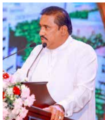
போன்று ஓர் ஆசனம் கிடைத்திருக்கும்.

கடந்த பொதுத் தேர்தலில் கருத்துறை, நுவரெலியா ஆகிய மாவட்டங்களில் சுதந்திரக் கட்சி தனித்துப் போட்டியிட்டது. கருத்துறை மாவட்டத்தில் 10 ஆயிரத்து 977 வாக்குகளும், நுவரெலியா மாவட்டத்தில் 6 ஆயிரத்து 277 வாக்குகளுமே கிடைக்கப் பெற்றன. சிலவேளை அனைத்து மாவட்டங்களிலும் அக்கட்சி தனித்துப் போட்டியிட்டிருந்தால் தேசியப்பட்டியல் ஊடாக மட்டுமே ஐ.தே.கவுக்குப்