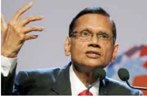
அனைத்து பாடசாலைகளின் அதிபர்கள், ஆசிரியர்கள் மற்றும் கல்விசாரா ஊழியர்களுக்கு தடுப்புசி செலுத்தும் நடவடிக்கையை ஆரம்பிக்கவுள்ளோம் என கல்வியமைச்சர் ஜி.எல். பீரிஸ் தெரிவித்துள்ளார்.

அதற்கமைய எதிர்வரும் 12 ஆம் திகதி முதல் தடுப்புசி செலுத்தும் பணிகள் ஆரம்பிக்கப்படவுள்ளன என அவர் மேலும் தெரிவித்தார். நாட்டிலுள்ள 10 ஆயிரத்து 155 பாடசாலைகளைச் சேர்ந்த அனைத்து கல்விசாரர், கல்விசாரா ஊழியர்களுக்கு இவ்வாறு கொரோனாத் தடுப்புசி செலுத்தப்படும் என கல்வியமைச்சர் தெரிவித்தார்.