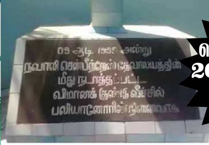
நவாலி படுகொலை நாள் 09.07.1995

இன்று வெள்ளிக்கிழமை 26 ஆவது ஆண்டு துயரமிக்க நினைவு நாள்