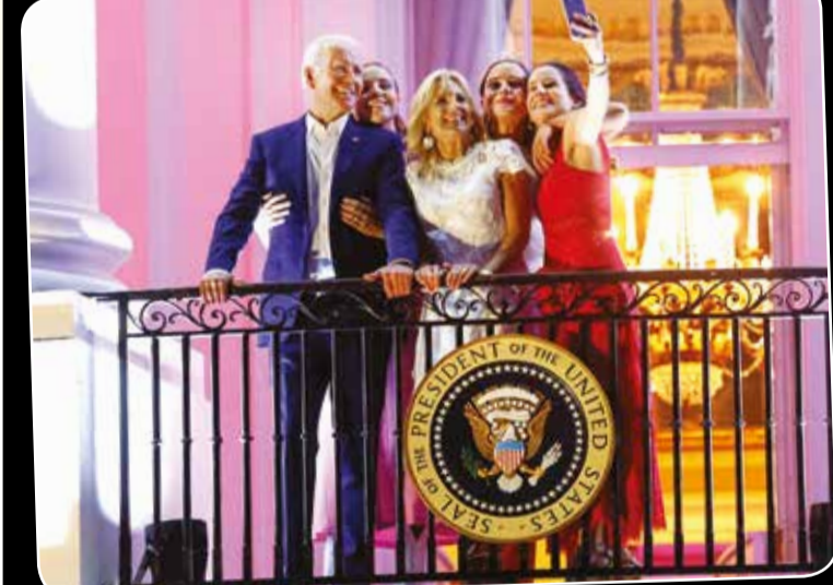
அமெரிக்க சுதந்திர தினத்தில் அந்நாட்டு ஜனாதிபதி ஜோ பைடன் தனது குடும்ப உறுப்பினர்களுடன் செல்பி எடுக்கும்போது புகைப்படக் கலைஞர் ஒருவரால் எடுக்கப்பட்ட படம் சமூக வலைத்தளங்களில் பிரபலமாகியுள்ளது.