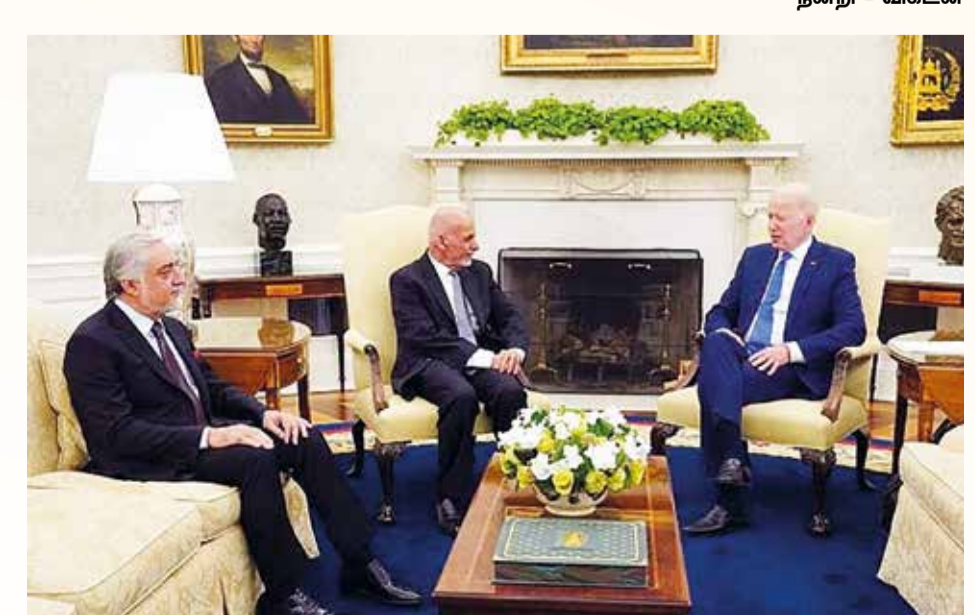
நன்றி - விகடன்

தங்கப்பிறை அபின் சாம்ராஜ்யம் உலகின் மொத்த அபின் உற்பத்தியில் 80% ஆப்கானிலிருந்து செல்வதால், அதில் கிடைக்கும் வருவாயை உள்நாட்டுப்