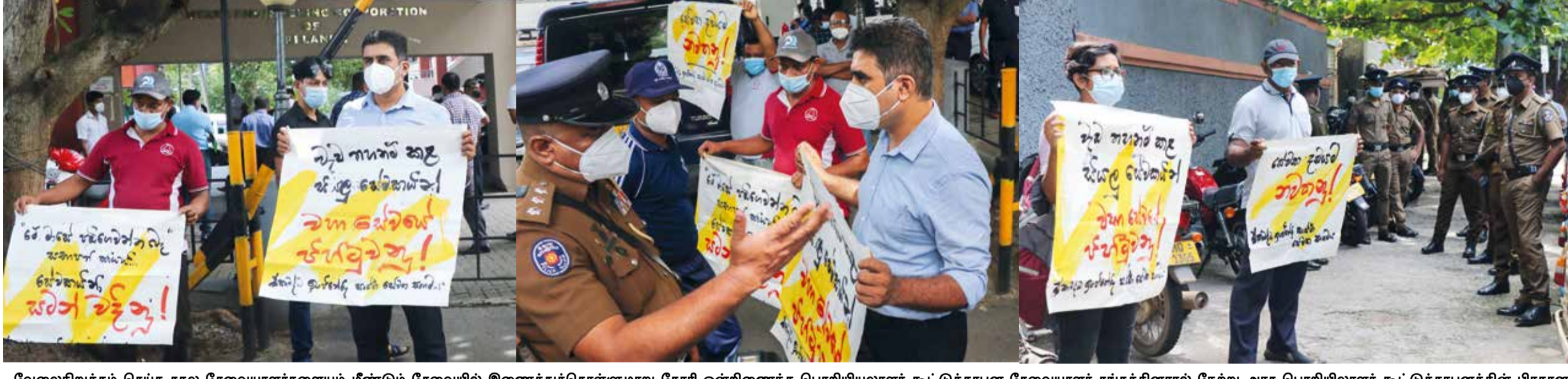
வேலைநிறுத்தம் செய்த சகல சேவையாளர்களையும் மீண்டும் சேவையில் இணைத்துக்கொள்ளுமாறு கோரி ஒன்றிணைந்த பொறியியலாளர் கூட்டுத்தாபன சேவையாளர் சங்கத்தினரால் நேற்று அரச பொறியியலாளர் கூட்டுத்தாபனத்தின் பிரதான காரியாலயத்தின் முன்னிலையில் எதிர்ப்புப் போராட்டம் முன்னெடுக்கப்பட்டது.