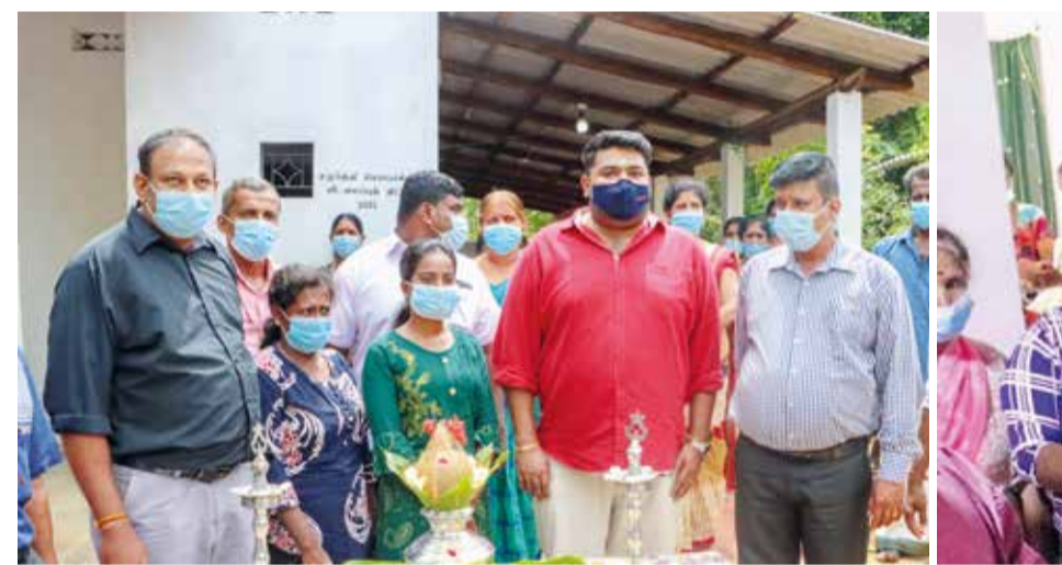
செனபாக்கியா வார வேலைத்திட்டத்தின் ஓர் அம்சமாக, வலிகாமம் வடக்கு தெல்லிப்பனை பிரதேச செயலகத்துக்குட்பட்ட ஜே/213 மல்லாகம் கிராமத்தில் கட்டப்பட்ட புதிய வீடு, பயனாளிகளிடம் கையளிக்கும் நிகழ்வு இடம்பெற்றது. நாடாளுமன்ற குழுக்களின் பிரதி தவிசாளரும், யாழ்.மாவட்ட ஒருங்கிணைப்புக் குழுவின்தலைவருமான அங்கஜன் இராமநாதன் இந்தநிகழ்வின் பிரதம விருந்தினராக கலந்துகொண்டார்.