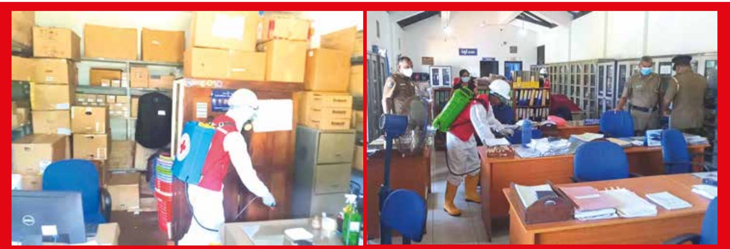
தொடர்ச்சியாக மக்கள் அதிகளவில் ஒன்றுகூடும் பொது இடங்களை கிருமித் தொற்றுநீக்கம் செய்யும் வேலைத்திட்டம் இலங்கை செஞ்சிலுவைச் சங்கத்தின் புத்தளம் கிளையினால் ஆரம்பிக்கப்பட்டுள்ளது. அதற்கமைய, சிலரபம் பிரிவுக்குப் பொறுப்பான பொலிஸ் காரியாலயம் செஞ்சிலுவைச் சங்கத்தினால் தொற்றுநீக்கம் செய்யப்பட்டது.

அத்துடன் இவரது பரிந்துரைக்கிணங்க மற்றுமொரு வீதியும், 04 இலட்சம் ரூபா செலவில் குருநாகல் மாநகர சபையின் நிதியொதுக்கீட்டின் மூலம், நிர்மாணிக்கப்பட்டு மக்களின் பாவனைக்காக கையளிக்கப்பட்டது. தெலியாகொன்னை பகுதியில் அமைந்துள்ள ரியால் உள்ளக வீதியே இவ்வாறு கையளிக்கப்பட்டது. இந்நிகழ்வில் இப்பிரதேச முக்கிய பிரமுகர்கள் உட்பட பலர் கலந்துகொண்டனர்.