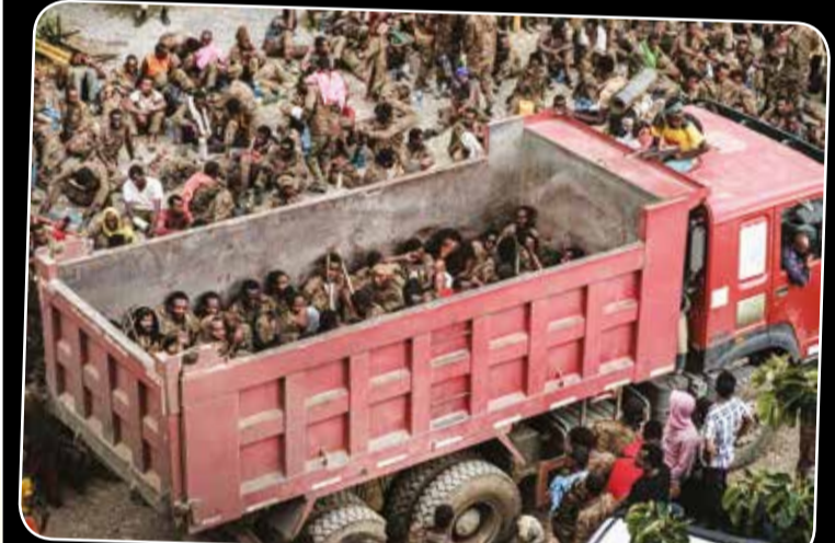
எத்தியோப்பியாவின் மெக்கலே பகுதியில் இடம்பெயர்ந்துள்ள மக்களுக்கு பாதுகாப்பு வழங்குவதற்காக பெரும் எண்ணிக்கையிலான இராணுவத்தினர் வரவழைக்கப்பட்டுள்ளனர். அவர்கள் தங்கியிருக்கும் பகுதியொன்றை படத்தில் காண்கிறீர்கள்.