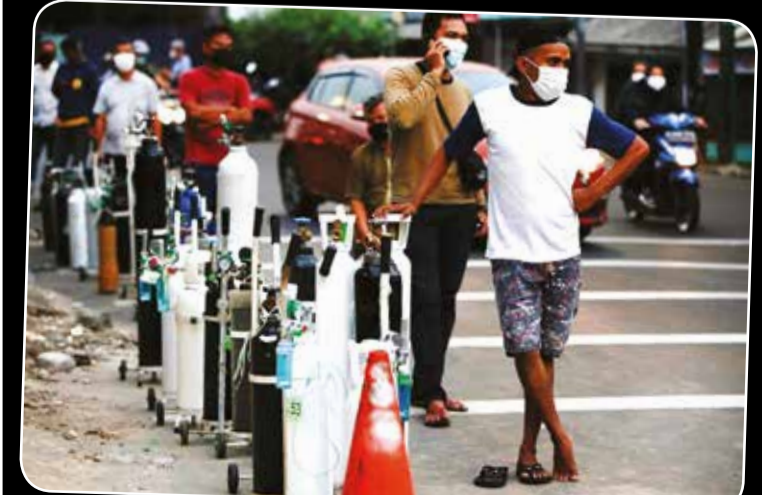
இந்தோனேஷியாவில் கொவிட் தொற்றுப் பரவல் தீவிரமடைந்துள்ளது. இதனால் அந்நாட்டில் ஒட்சிசனுக்கான தேவையும் அதிகரித்துள்ளது. ஐகார்த்தாவிலுள்ள வைத்தியசாலையொன்றுக்கு அருகில் ஒட்சிசன் நிரப்பிக்கொள்ள பெருந்திரளானோர் காத்திருந்தனர்.