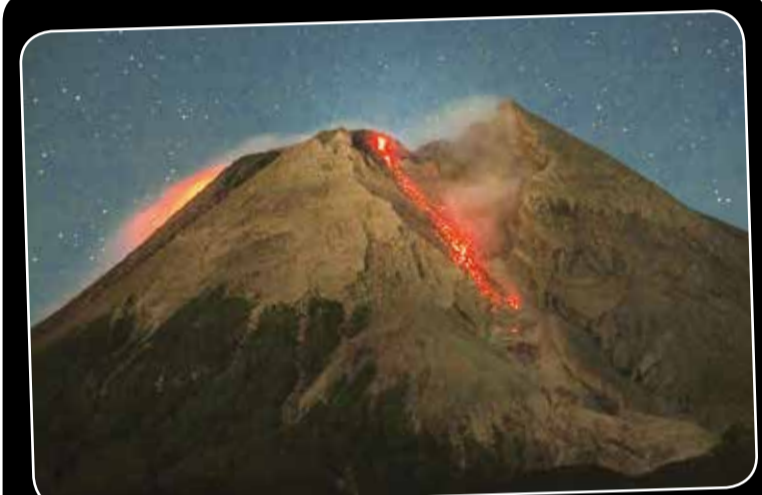
இந்தோனேஷியாவின் மெராபி எரிமலையிலிருந்து குழம்பு வெளியேறத் தொடங்கியுள்ளது. இதன்காரணமாக அப்பகுதியில் வசித்த மக்கள் பாதுகாப்பான இடங்களுக்கு அழைத்துச் செல்லப்பட்டுள்ளனர்.