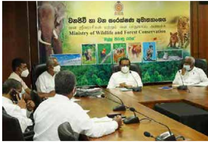
விடுவிக்கப்பட்டு விவசாய நடவடிக்கைகள் ஆரம்பிக்கப்படும் பட்சத்தில், அரசாங்கத்தின் சுபீட்சத்தின் நோக்கு வேலைத்திட்டத்தை விரைவுபடுத்த முடியும் எனவும் தெரிவித்தார்.

அத்துடன், குறித்த காணிகளில் விவசாய நடவடிக்கைகளை மேற்கொள்வதற்கு வடக்கு விவசாயிகள் ஆர்வமாக இருக்கின்றமையையும் சுட்டிக்காட்டிய அமைச்சர் டக்ளஸ் தேவானந்தா, சம்பந்தப்பட்ட நிலங்கள்