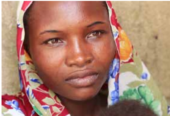
அதிகரித்து வரும் உணவுப் பொருள்களின் விலையேற்றம் உலகம் முழுவதும் கூடுதலாக 40

விழுக்காடு மக்கள் உணவுப் பற்றாக்குறைக்கு ஆளாகி இருக்கின்றனர் என ஐ.நா. தெரிவித்துள்ளது. ஐ.நா.வின் உலக உணவுத் திட்டத்தின் அறிக்கையில், மக்களுக்கு இடையேயான மோதல், காலநிலை மாற்றம் மற்றும் கொரோனா தொற்று காரணமாக உணவுப் பற்றாக்குறையால் 27 கோடி மக்கள் பாதிக்கப்பட்டுள்ளனர் என கூறப்பட்டுள்ளது. இவை தவிர சர்வதேச சந்தையில் விற்கப்படும் உணவுப் பொருள்களின் விலை கிட்டத்தட்ட 34 விழுக்காடு உயர்ந்துள்ளதாக அந்த அறிக்கையில் தெரிவிக்கப்பட்டுள்ளது. லெபனான் நாட்டில் கோதுமை மாவின் விலை 219 மடங்கும், சமையல் எண்ணெயின் விலை 440 மடங்கும் உயர்ந்திருப்பதையும் ஐ.நா. அறிக்கையில் சுட்டிக் காட்டப்பட்டுள்ளது.